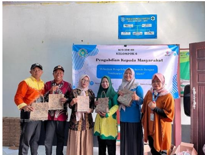
Gambar 6 Pembagian Souvenir Kepada Peserta Terbaik

Di akhir kegiatan kami memberikan souvenir bagi peserta terbaik sekaligus memberikan evaluasi lebih lanjut bahwa kegiatan pengabdian masyarakat yang kami lakukan di terima dan disambut dengan baik oleh masyarakat diharapkan kegiatan pengelolaan air bersih di desa sungai pinang lama di lanjutkan dan dikembangkan lebih baik lagi untuk mendukung kesehatan dan penggunaan air bersih di desa tersebut.