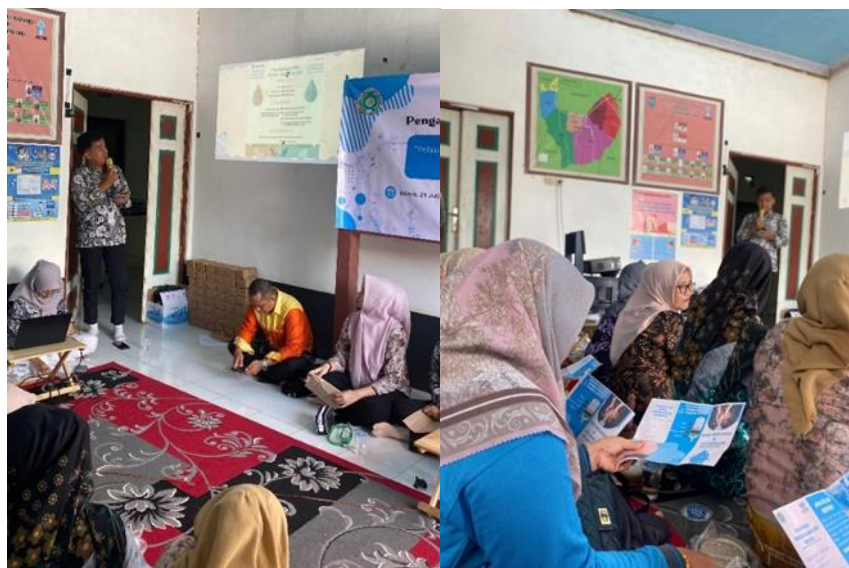
Gambar.2 Penyampaian Materi Dan Pembagian Leaflet Ke Masyarakat

Kemudian acara pengabdian masyarakat dilaksanakan pada hari Kamis tanggal 25 Juli 2024 yang bertempat di posyandu dan pos bindu “Anggrek”. Kegiatan diawali dengan melakukan pre-test untuk mengukur pengetahuan masyarakat melalui pengisian kuesioner. Selanjutnya masyarakat di berikan materi tentang pengelolaan air bersih juga diberikan leaflet . Masyarakat tidak memasak air terlebih dahulu karena beranggapan bahwa air yang dimasak tidak nyaman di minum karena rasanya berbeda. Materi tentang pengelolaan air bersih yang di berikan meliputi cara membedakan air bersih dengan air tidak bersih secara kimia dan fisika, faktor risiko jika mengonsumsi air yang kurang bersih, dan bagaimana cara mengelola air tidak bersih siap konsumsi. Masyarakat sudah memperoleh pengetahuan tersebut dari media informasi lain. Seseorang yang telah mengetahui suatu informasi, maka akan mampu menentukan dan mengambil keputusan harus menghadapi suatu masalah, tetapi meski masyarakat Desa Sungai Pinang Lama sudah memiliki pengetahuan yang baik mengenai pengelolaan air minum dan air bersih, namun beberapa dari mereka belum bisa melanjutkan ke aspek perilaku. Dengan tujuan masyarakat dapat memahami dan meningkatkan pengetahuan tentang pengelolaan air bersih juga diharapkan masyarakat dapat mengaplikasikan dan menyebar luaskan materi ini kepada tetangga/kerabat sekitar.