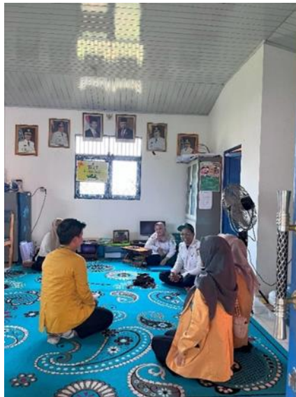
Gambar 1 Koordinasi Dengan Pambakal Terkait Pelaksanaan Kegiatan

Kemudian acara pengabdian masyarakat dilaksanakan pada hari Kamis tanggal 25 Juli 2024 yang bertempat di posyandu dan pos bindu “Anggrek”. Kegiatan diawali dengan melakukan pre-test untuk mengukur pengetahuan masyarakat melalui pengisian kuesioner. Selanjutnya masyarakat di berikan materi tentang pengelolaan air bersih juga diberikan leaflet . Masyarakat tidak memasak air terlebih dahulu karena beranggapan bahwa air yang dimasak tidak nyaman di minum karena rasanya berbeda. Materi tentang pengelolaan air bersih yang di berikan meliputi cara membedakan air bersih dengan air tidak bersih secara kimia dan fisika, faktor risiko jika mengonsumsi air yang kurang bersih, dan bagaimana cara mengelola air tidak bersih siap konsumsi. Masyarakat sudah memperoleh pengetahuan tersebut dari media informasi lain. Seseorang yang telah mengetahui suatu informasi, maka akan mampu menentukan dan mengambil keputusan harus menghadapi suatu masalah, tetapi meski masyarakat Desa Sungai Pinang Lama sudah memiliki pengetahuan yang baik mengenai pengelolaan air minum dan air bersih, namun beberapa dari mereka belum bisa melanjutkan ke aspek perilaku. Dengan tujuan masyarakat dapat memahami dan meningkatkan pengetahuan tentang pengelolaan air bersih juga diharapkan masyarakat dapat mengaplikasikan dan menyebar luaskan materi ini kepada tetangga/kerabat sekitar.