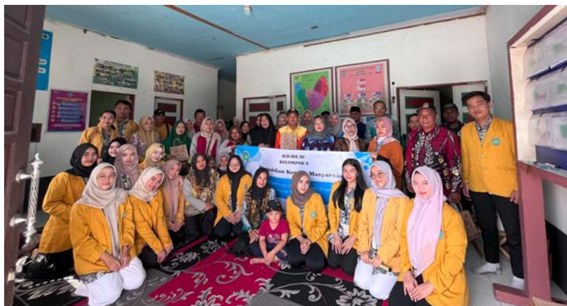
Gambar 7 Dokumentasi Kegiatan PKM Desa Sungai Pinang Lama