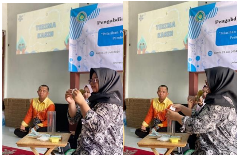
Gambar 3 Pelatihan Pembuatan Filter Air Bersih Alami Berbahan Karbon Aktif

Kegiatan dilanjutkan dengan pelatihan pembuatan filter sederhana berbahan karbon aktif salah satu cara pengelolaan air bersih yaitu dengan filter (penyaringan) yang kami jadikan Solusi untuk Masyarakat di desa sungai pinang lama karena pembuatannya mudah, bahan bakunya terjangkau dan mudah di temukan. Filter air alami berbahan karbon aktif adalah teknologi yang memanfaatkan sifat absorptif karbon untuk menyaring kontaminan dari air. Karbon aktif dibuat dari bahan organik seperti batok kelapa, kayu, atau batu bara yang dipanaskan pada suhu tinggi dalam kondisi tanpa oksigen, menghasilkan struktur berpori dengan luas permukaan yang sangat besar. Proses ini memungkinkan karbon aktif untuk menyerap berbagai jenis kontaminan melalui mekanisme adsorpsi, di mana molekul-molekul kontaminan menempel pada permukaan pori-pori karbon. Filter karbon aktif sangat efektif dalam menghilangkan bahan kimia organik, klorin, bau, dan rasa tidak sedap dari air, sehingga meningkatkan kualitas air minum. Hasil filter tersebut lebih baik di rebus lagi langsung untuk memastikan air benar-benar aman untuk dikonsumsi. Pemeliharaan rutin, termasuk penggantian media karbon aktif secara berkala, diperlukan untuk menjaga efektivitas filter ini. Dengan memahami cara kerja dan manfaat filter karbon aktif, kita dapat lebih bijak dalam memilih dan menggunakan teknologi ini untuk memastikan ketersediaan air bersih dan aman (Smith et al , 2020).