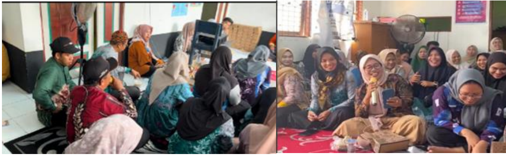
Gambar 4 Sesi Tanya Jawab Dan Diskusi Bersama Masyarakat

Setelah itu dilakukan posttest untuk mengukur pengetahuan masyarakat setelah diberikan edukasi tentang pengelolaan air bersih dan pelatihan pembuatan filter air bersih.