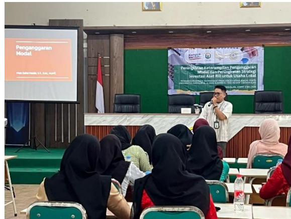
Gambar 6. Permulaan Sesi Kedua

fasilitator mendorong peserta untuk mengaplikasikan konsep-penganggaran modal ke dalam konteks usaha lokal masing-masing (Gambar 6).