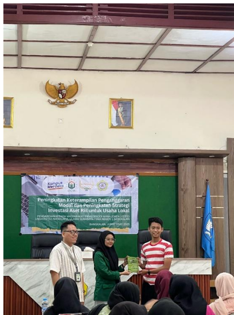
Gambar 5. Sesi Pemberian Hadiah Quiz

Penyampaian materi dilakukan secara komunikatif dan partisipatif, dengan diselingi quiz berhadiah serta sesi tanya jawab interaktif (Gambar 5). Antusiasme peserta terlihat dari banyaknya pertanyaan yang diajukan, terutama terkait praktik manajemen yang sesuai dengan karakter usaha lokal. Quiz juga meningkatkan keterlibatan peserta dan memperkuat pemahaman terhadap materi yang telah disampaikan.