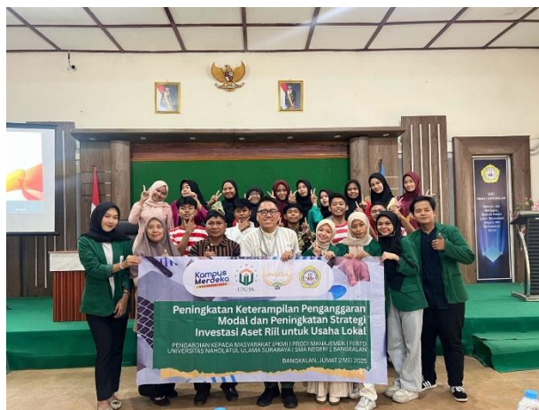
Gambar 8. Sesi Foto Dosen, Mahasiswa, Peserta Siswa, dengan Wakil Kepala Sekolah Bidang Kesiswaan dan Tim Bimbingan Konseling