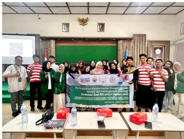
Gambar 7. Sesi Foto dengan Peserta dan Fasilitator

Di akhir kegiatan, dilakukan pembuatan konten dokumentasi oleh tim fasilitator mahasiswa, serta sesi foto bersama dengan peserta serta dengan Wakasek Kesiswaan dan Tim Bimbingan Konseling (Gambar 7 dan 8).