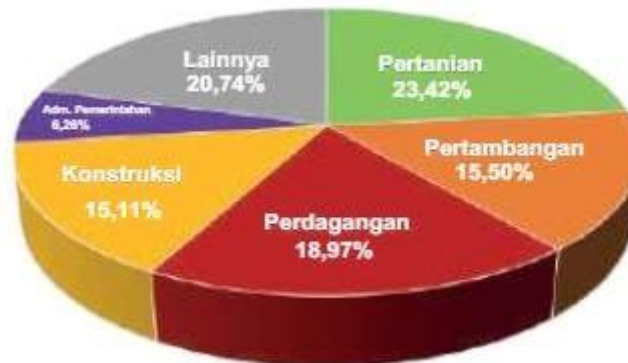
Gambar 2. Kontribusi Terbesar PDRB Menurut Lapangan Usaha (BPS Bangkalan, 2024; Hakiki et al., 2024)

Sementara itu, pada Gambar 2 terdapat diagram yang menunjukkan sektor-sektor usaha yang paling banyak menyumbang distribusi PDRB, antara lain sektor pertanian, perdagangan, tambang, dan konstruksi, diikuti oleh sektor administrasi pemerintahan, dan lain-lain. Dari 5 besar sektor dengan distribusi penyumbang PDRB di atas, 3 sektor mengalami pertumbuhan yang negatif, sedangkan 2 sektor (perdagangan dan konstruksi) mengalami pertumbuhan positif.