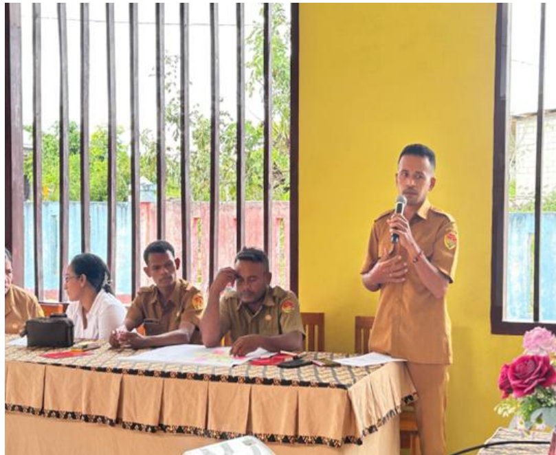
Gambar 2. Peserta mempresentasikan hasil diskusi kelompok

Kegiatan pengabdian kepada masyarakat diikuti oleh 17 orang peserta yang semuanya merupakan guru di di SLB Negeri Lobalain, Kabupaten Rote-Ndao. Dilakukan pengukuran untuk mengetahui efektifitas pelatihan berdasarkan perbedaan skor pemahaman peserta sebelum dan sesudah diberikan materi pelatihan. Pengukuran efektifitas pelatihan dilakukan dengan metode kuasi eksperimental menggunakan desain penelitian one-group pretest-posttest design (Christensen, 2001). Variabel terikat yang diukur adalah pemahaman guru di di SLB Negeri Lobalain, Kabupaten Rote-Ndao tentang materi pelatihan yang diukur melalui skor pretest dan posttest yang diperoleh guru. Sementara itu, variabel bebas penelitian adalah pelatihan training of trainers (ToT) kepada para guru di SLB Negeri Lobalain yang dilakukan dengan teknik ceramah, diskusi kelompok, serta tanya-jawab. Selanjutnya, data hasil pengukuran pada 17 orang partisipan penelitian dianalisis menggunakan teknik repeated measures t-test pada software JASP 0.18.10 .