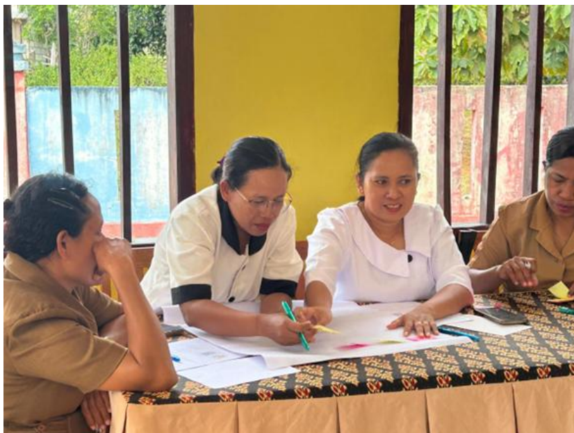
Gambar 1. Peserta pelatihan mengerjakan tugas pelatihan dalam kelompok