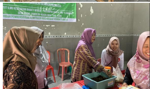
Gambar 3. Dokumentasi pelatihan budidaya maggot bersama kelompok tani — peserta menyiapkan media, memanen larva, serta membersihkan maggot segar.