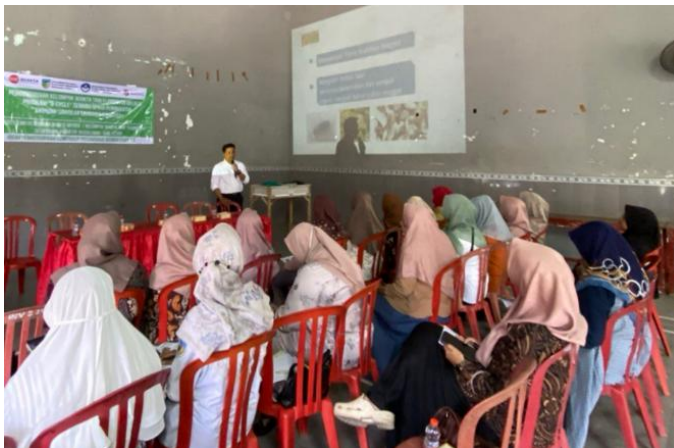
Gambar 1a. Sosialisasi budidaya Maggot

Sosialisasi teknik budidaya maggot dilakukan dengan menghadirkan narasumber dari DLHKP Kota Kediri. Pada tahap ini, narasumber memaparkan cara teknik budidaya maggot dengan memanfaatkan limbah pertanian serta manfaat budidaya maggot bagi ekonomi sirkular (Gambar 1a). Disamping itu, pada tahap ini, mitra diberikan leaflet mengenai siklus hidup Black Soldier Fly (BSF) dan cara budidaya maggot skala rumah tangga (Gambar 1b) serta diputarkan video tutorial budidaya maggot. Acara dilanjutkan dengan diskusi interaktif antara mitra, narasumber, dan tim PKM mengenai peluang usaha budidaya maggot, pemanfaatan maggot serta strategi pengelolaan limbah organik dengan budidaya maggot.