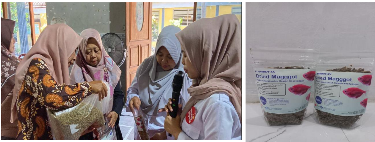
Gambar 4. Pendampingan Pengemasan Maggot kering

Pendampingan pengemasan maggot kering dilakukan pada kelompok KWT Desa Badal Pandean menggunakan standing pouch yang lebih premium untuk memperkuat branding produk dan memperpanjang daya simpan (Mulyati, dkk., 2024). Pendekatan ini diharapkan mampu memberikan pemahaman mitra dalam upaya peningkatan kualitas dan nilai jual produk, khususnya maggot. Pada tahap ini, juga diukur pemahaman mitra terkait proses produksi maggot kering, teknik pengemasan, manfaat pengemasan terhadap mutu dan masa simpan, hingga kepuasan mitra terhadap kegiatan (Tabel 3).