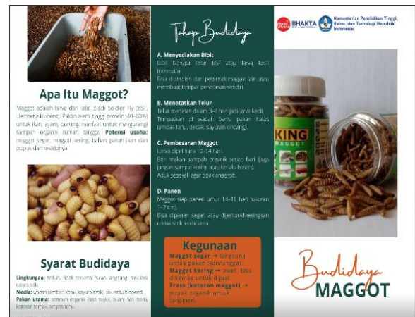
Gambar 1b. Leaflet budidaya Maggot

Pemahaman mitra dalam teknik budidaya maggot selanjutnya diukur dengan kuesioner melalui pre-test dan post-test. Berdasarkan hasil pengukuran (Tabel 1), sebelum kegiatan sosialisasi sebagian besar mitra belum mengenal budidaya maggot, hanya 20% yang pernah mendengar manfaat maggot. Namun setelah kegiatan, 100% mitra memahami potensi maggot sebagai pengurai limbah organik dan pakan alternatif.