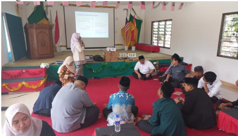
Gambar 2 Kegiatan edukasi literasi finansial di pondok pesantren An Nahdhoh Malaysia

Setelah kegiatan pembinaan karakter relegius, dilanjutkan dnegan kegiatan edukasi literasi finansial, berikut ini kegiatannya :