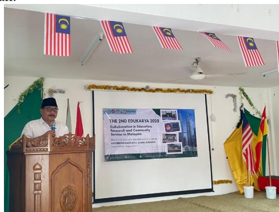
Gambar 1 Pemberian pembinaan karakter religius di pondok pesantren An Nahdhoh Malaysia