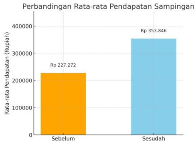
Gambar 3. Perbandingan rata - rata pendapatan sampingan anggota KWT sebelum dan sesudah kegiatan pelatihan

Selain peningkatan keterampilan teknis, pelatihan ini juga berdampak nyata terhadap peningkatan pendapatan masyarakat. Berdasarkan survei lanjutan, rata – rata pendapatan sampingan anggota KWT meningkat dari Rp227.272 sebelum pelatihan menjadi Rp353.846 setelah pelatihan, sebagaimana terlihat pada Gambar 3. Peningkatan pendapatan sebesar Rp126.574 atau sekitar 55,7% ini menunjukkan bahwa kegiatan pelatihan tidak hanya berdampak pada peningkatan kemampuan produksi, tetapi juga berkontribusi langsung terhadap peningkatan kesejahteraan ekonomi anggota kelompok.