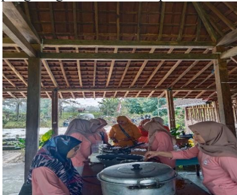
Gambar 1. Dokumentasi kegiatan pembuatan produk olahan abon lele, basreng lele, dan chili flakes oleh anggota KWT Laras Pandowo

Kegiatan pelatihan pengolahan produk pangan yang dilaksanakan oleh tim PPKO HMTP UAD 2025 bersama KWT Laras Pandowo berlangsung dengan lancar dan diikuti oleh 19 anggota aktif. Pelatihan dilaksanakan pada Jum'at, 22 Agustus 2025 di Omah Sabin Setalang, Desa Pandowoharjo, Sleman, dengan fokus pada pengolahan hasil panen lokal berupa cabai, bawang merah, dan ikan lele menjadi produk olahan bernilai jual seperti abon lele, bakso goreng lele (basreng lele), dan chili flakes . Seluruh peserta terlibat secara aktif dalam proses pembuatan produk. Dokumentasi kegiatan pembuatan produk dapat dilihat pada Gambar 1, yang memperlihatkan proses penggorengan basreng lele, penumisan abon lele, dan pengeringan cabai untuk pembuatan chili flakes .