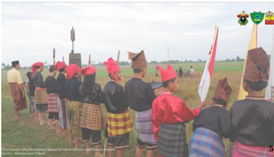
Gambar. 3. Appalili di Kerajaan Adat Marusu

Proses ini berhasil direkam secara utuh dalam bentuk audio-visual, dan menjadi salah satu konten utama dalam video dokumenter. Appalili merupakan ritual agraris yang menyimbolkan harmoni manusia, alam, dan leluhur.