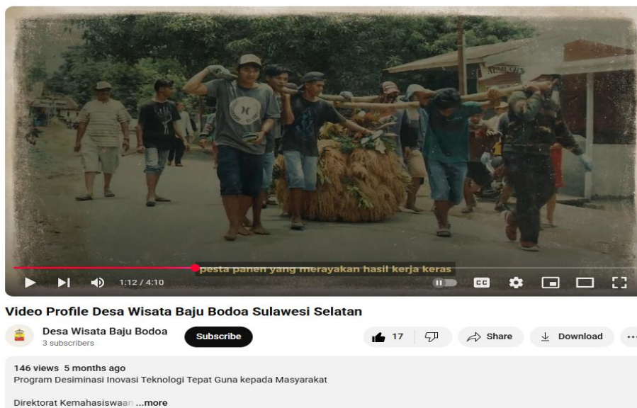
Gambar. 2. Tangkapan layar hasil pembuatan video profil desa wisata

Dokumenter berdurasi 4 menit ini menampilkan narasi sejarah, wawancara dengan tokoh adat, visualisasi situs budaya, dan prosesi adat Appalili. Video ini diunggah melalui kanal YouTube komunitas sebagai media pelestarian dan edukasi digital berbasis lokal.