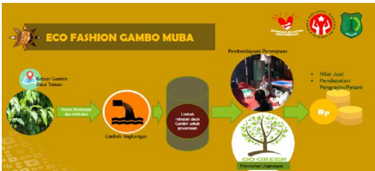
Sumber: Gambar 1 proses awal getah Gambir, 2020

Dimana-mana usaha mengalami kemacetan bisnis secara mendadak, sehingga untuk bertahan hidup ibu-ibu di kabupaten Musi Banyuasin menggelutin usaha mikro kecil menengah yaitu Gambo Muba sebagai produk rumahan, yang mereka lakukan untuk menopang ekonomi keluarga. Produk UMKM rumahan inilah cara masyarakat Muba untuk mencegah penularan virus Corona dari orang ke orang akibat kontak langsung, sehingga setiap orang harus menjaga jarak agar penyebaran virus dapat dikurangi kemudian intruksi pemerintah aktivitas di luar rumah dikurangi agar virus tidak menyebar luas. Gambo Muba termasuk produk modern secara proses pembuatan, tetapi juga modern dari tampilan dan jangkauan pasarnya Brentani & De. (1993). Jumputan diberi nama Gambo ini karena bahan pewarnaannya berasal dari getah Gambir kalau biasanya ada pakai zat kimia, kali ini dibuat dengan pewarnaan alami seperti gambar dibawah ini proses awal getah gambir: