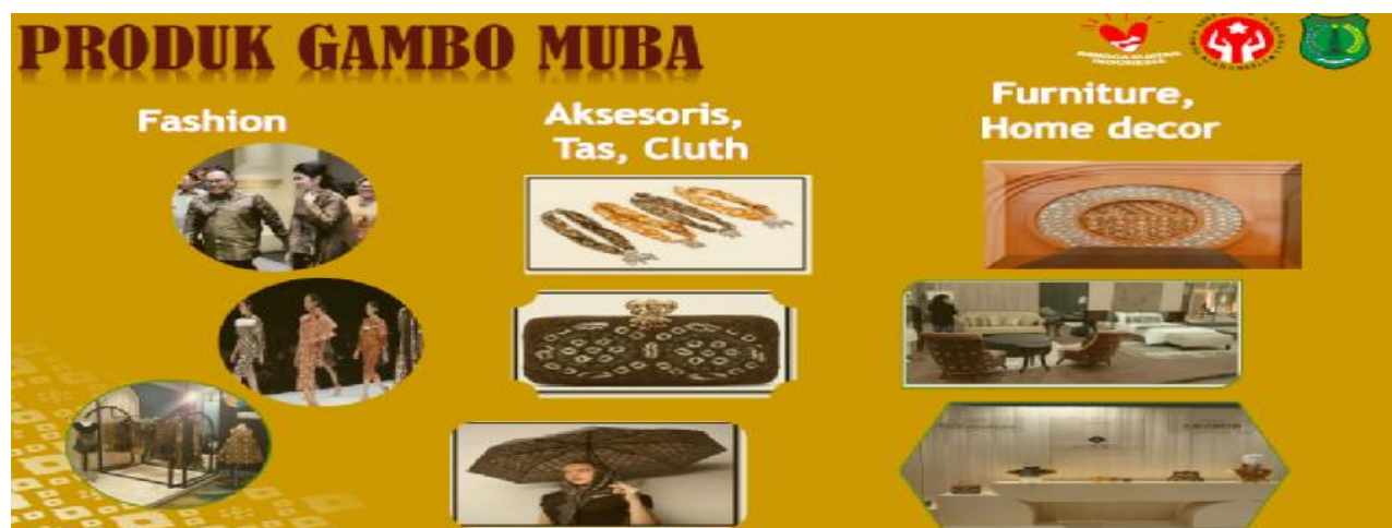
Sumber : gambar 2 adalah produk hasil olahan getah Gambir d Muba, 2020

Pewarna alami getah Gambir ini pada sebuah kayu alami putih polos ternyata pewarna getah Gambo bisa mengubah warna lebih indah. Ketika diaplikasikan pada interior bisa jadi se-modern. Produk Gambo Muba mampu menjadi trend furniture berdaya saing global, seperti terlihat pada gambar berikut ini.