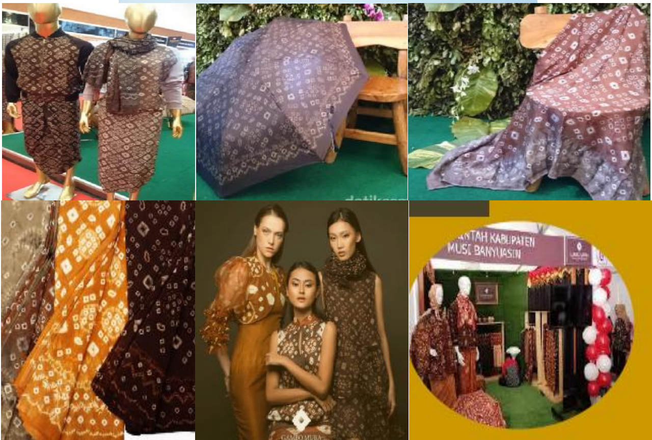
Gambar 3: Hasil UMKM Produk Gambo Muba, 2020