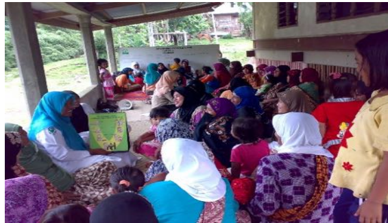
Gambar 3. Penyuluhan Kesehatan

Brosur Posyandu bermanfaat untuk meningkatkan pengetahuan masyarakat tentang kesehatan ibu dan anak. Manfaatnya juga akan didapatkan oleh orang atau tetangga lainnya yang tidak wajib datang ke Posyandu.