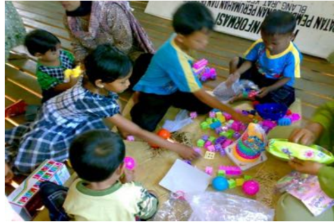
Gambar 2. Anak-anak bermain Bersama di Posyandu