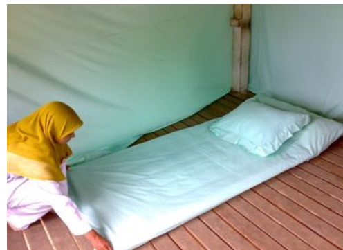
Gambar 1. Beberapa Perlengkapan Posyandu