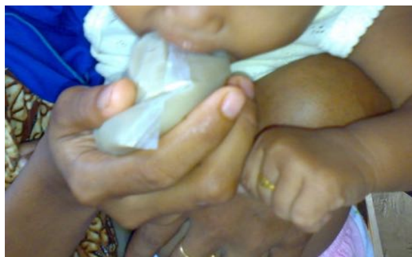
Gambar 4. Program makanan tambahan di Posyandu

Disamping itu, ketersediaan makanan tambahan akan terus diupayakan kader desa melalui program swadaya masyarakat di desa. Setiap pengunjung Posyandu akan memberikan kontribusi berdasarkan kesepakatan. Hal itu dilakukan dalam rangka menjaga stabilitas kegiatan posyandu meskipun tidak ada bantuan dari luar.