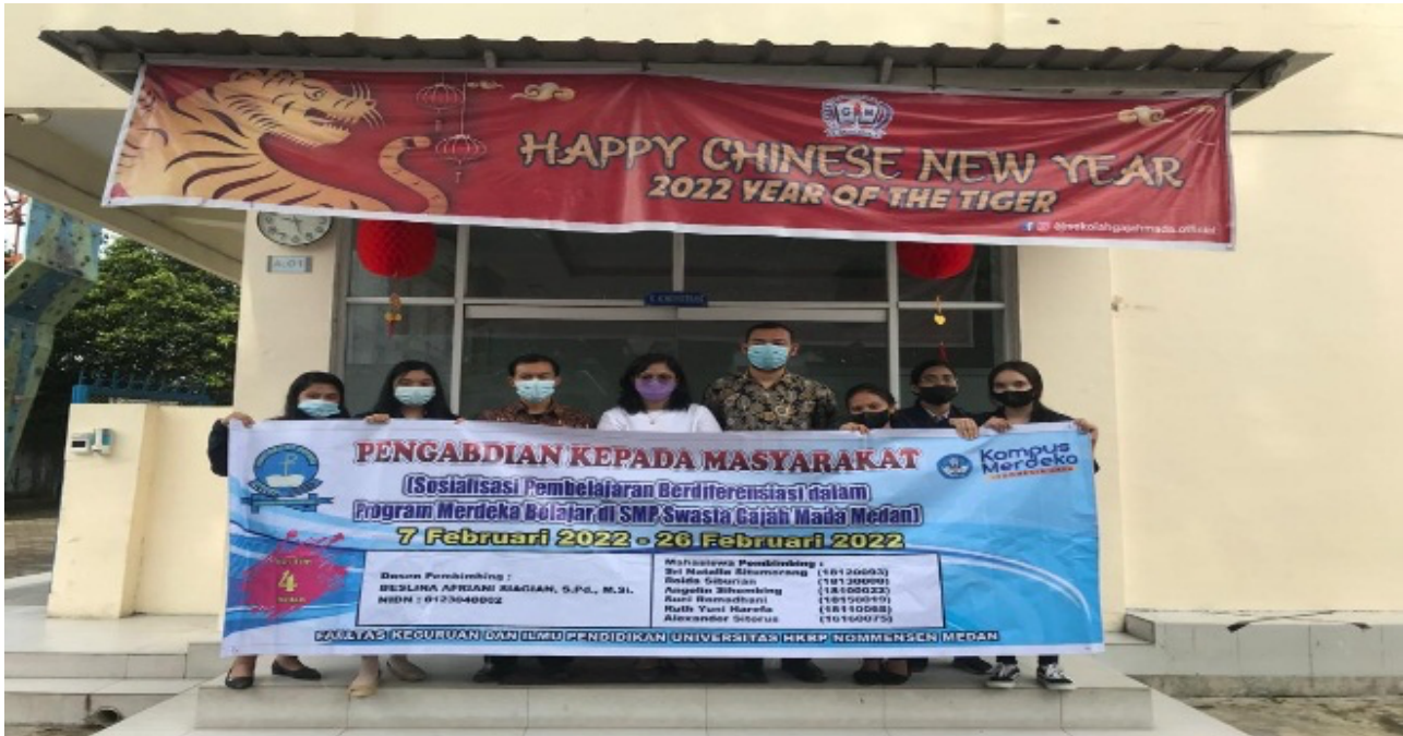
Gambar 1. Penyerahan mahasiswa PKM oleh DPL kepada pihak SMP Swasta Gajah Mada Medan