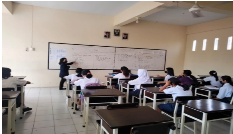
Gambar 2. Kegiatan pembelajaran di kelas VII dan VIII-A dan VIII-B untuk mata pelajaran Bahasa Inggris dan IPA