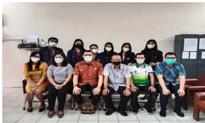
Gambar 4. Dokumentasi kegiatan penjemputan di sekolah SMP Gajah Mada bersama DPL dan Wakil Kepala Sekolah dan guru - guru