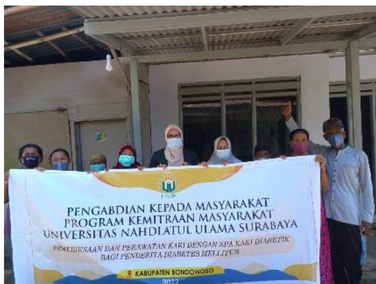
Gambar 1: Survey kelompok sasaran

Tim mendatangi lokasi pengabdian kepada masyarakat yang sudah memenuhi kriteria yaitu wilayah dengan kasus Diabetes Mellitus, kemudian melakukan wawancara dan observasi.