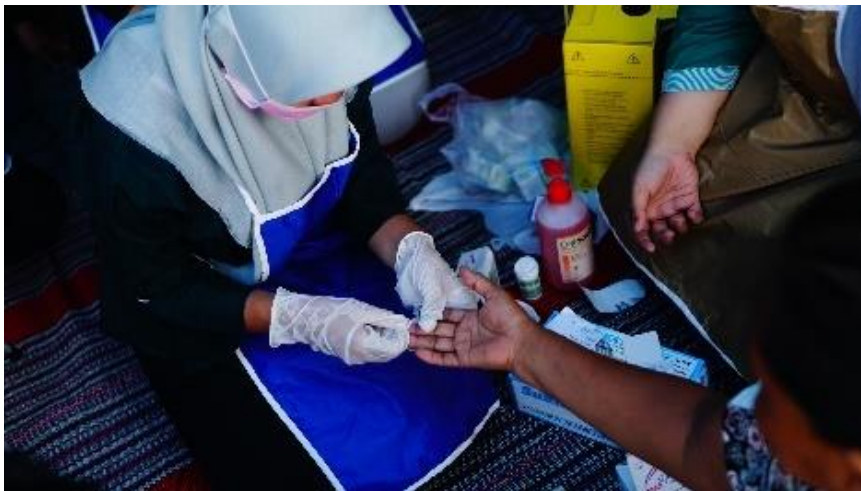
Gambar 2 Pemeriksaan gula darah

Program yang juga penting dalam pengabdian kepada masyarakat ini adalah pemberian edukasi tentang pemeriksaan kaki dan perawatan kaki. Kegiatan selanjutnya adalah melakukan pemeriksaan gula darah dan pemeriksaan kaki kemudian dilanjutkan dengan demonstrasi perawatan kaki dengan SPA kaki diabetik dan diakhiri dengan pemeriksaan gula darah kembali.