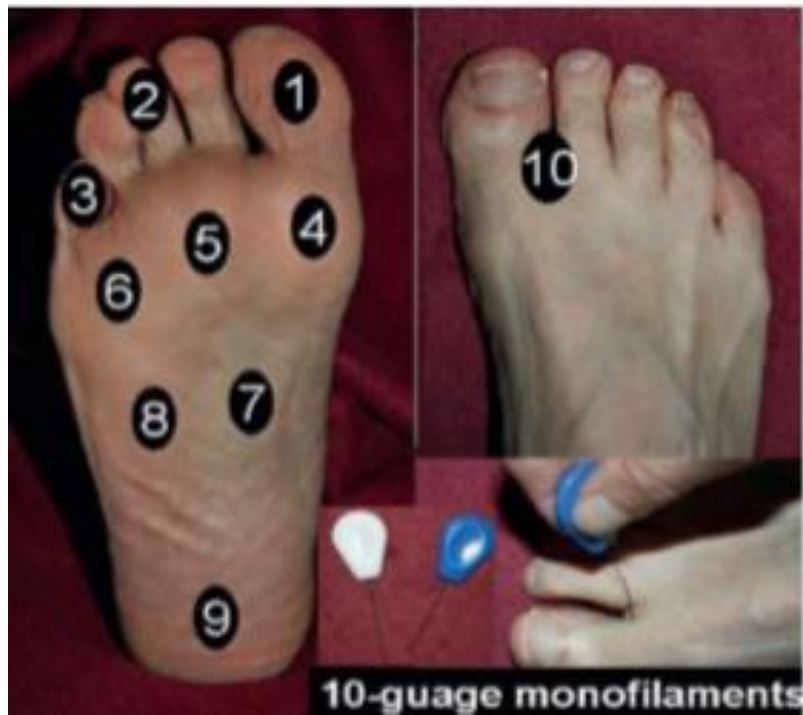
Gambar 3 Pemeriksaan 10 titik pada kaki