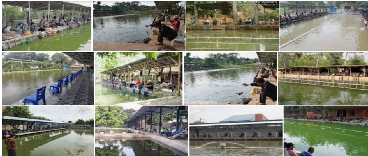
Gambar 7 Kolam Pemancingan, 2021

Banyak sekali sisi positif dari kolam pemancingan ikan bila dikelola dengan benar akan tetapi seperti biasa dimana ada peluang disitu pula terdapat tantangan. Salah satu hal yang dapat dilihat sebagai peluang adalah kebanyakan bisnis kolam pemancingan ikan belumlah dikelola secara profesional dengan sistem manajemen modern. Banyak sekali kolam pemancingan ikan yang hanya berupa kolam dan plank nama padahal apabila kita ingin berbisnis yang baik dengan strategi jangka panjang hingga bisa diwariskan kepada anak cucu, program branding, marketing dan corporate identity sangatlah penting dilakukan. (Chang, 2012: Budi, 2013).