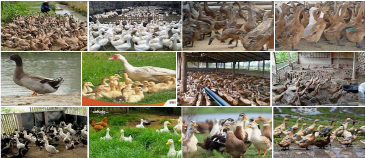
Gambar 5 Ternak bebek, Muba 2021.