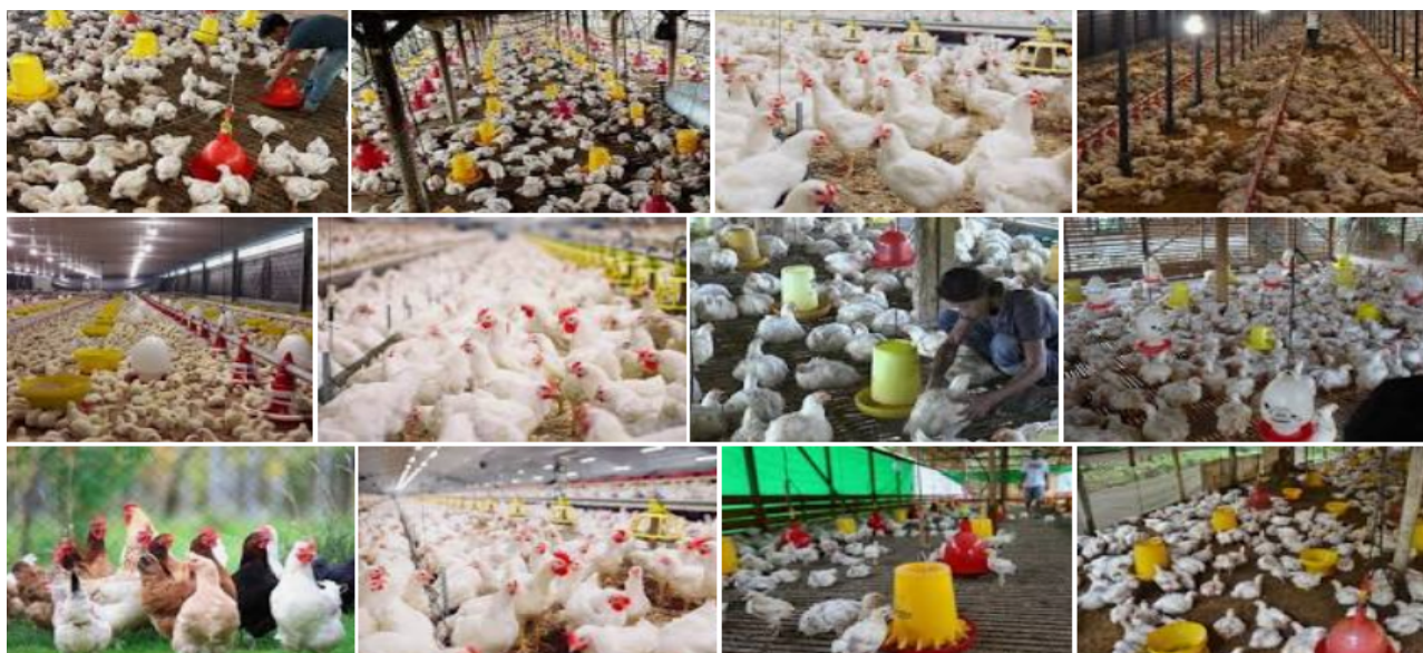
Gambar 4: Ayam petelur Muba, 2021.

Sistem semi intensif juga membutuhkan kandang untuk tempat berlindung ayam dan juga tempat untuk bertelur. Saat bertelur, telur ayam tersebut bisa dipisahkan dari induknya dan ditetaskan dengan alat seperti inkubator, atau dengan indukan yang lain.