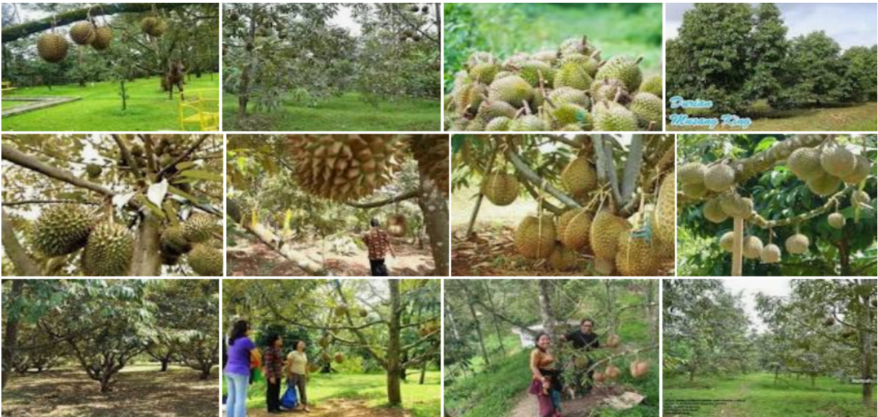
Gambar 1: Kebun Durian Muba, 2021