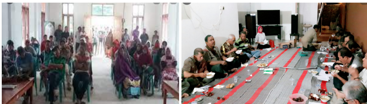
Gambar 2: Pertemuan dengan para toko dan masyarakat desa, 2021

Pendamping dengan ketrampilan khusus yang diperoleh dari lingkup pendidikannya atau dari pengalamannya dapat memberikan keterangan-keterangan teknis yang dibutuhkan oleh masyarakat saat mereka melaksanakan kegiatannya.