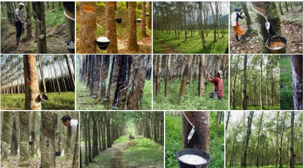
Gambar 2: perkebunan Karet Muba, 2021

Karet adalah polimer hidrokarbon yang terkandung pada latek sbeberapa jenis tumbuhan. Sumber utama produksi karet dalam perdagangan internasional adalah paraatau Hevea brasiliensis (suku Euphorbiaceae). Beberapa tumbuhan lain juga menghasilkan getah lateks dengan sifat yang sedikit berbeda dari karet, seperti anggota suku ara-araan (misalnya beringin), sawo-sawoan (misalnya getah percadan sawo manila), Euphorbiaceae lainnya, serta dandelion. Pada masa Perang Dunia II, sumber-sumber ini dipakai untuk mengisi kekosongan pasokan karet dari para. Sekarang, getah perca dipakai dalam kedokteran (guttapercha), sedangkan lateks sawo manila biasa dipakai untuk permen karet chicle). Karet industri sekarang dapat diproduksi secara sintetis dan menjadi saingan dalam industri perkaretan. Kabupaten Muba memiliki salah satu sumber penghasilan masyarakat yaitu perkebunan karet. Masyarakat juga belum bisa memanfaatkan untuk kegiatan kreatif, karet masih dijual berupa getah beku seperti pada umumnya di Muba. (Hansen, Saridakis, Benson, 2018).