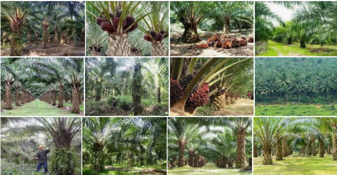
Gambar 3 Kebun Sawit, 2021

Indonesia adalah penghasil minyak kelapa sawit terbesar di dunia. Di Indonesia penyebarannya di daerah Aceh , pantai timur Sumatra , Jawa, Kalimantan, dan Sulawesi. Terdapat beberapa spesies kelapa sawit yaitu E. guineensis Jacq., E. oleifera , dan E. odora . Varietas atau tipe kelapa sawit digolongkan berdasarkan dua karakteristik yaitu ketebalan endokarp dan warna buah. Berdasarkan ketebalan endokarpnya, kelapa sawit digolongkan menjadi tiga varietas yaitu Dura, Pisifera, dan Tenera, sedangkan menurut warna buahnya, kelapa sawit digolongkan menjadi tiga varietas yaitu Nigrescens, Virescens, dan Albescens. Secara umum, kelapa sawit terdiri atas beberapa bagian yaitu akar, batang, daun, bunga dan buah. Bagian dari kelapa sawit yang dilolah menjadi minyak adalah buah.