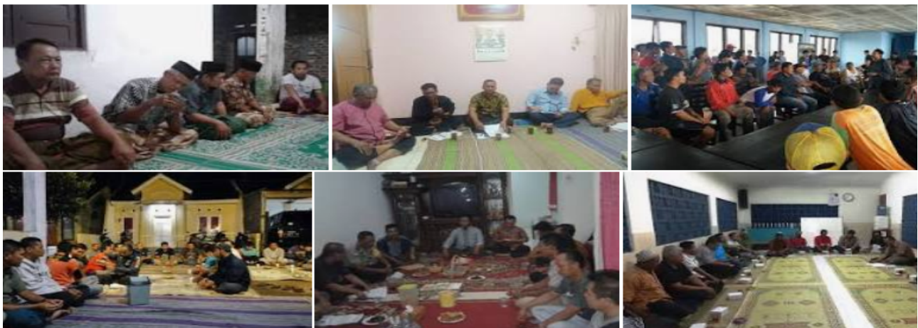
Gambar 1: Pertemuan dengan para toko dan masyarakat desa, 2021

Pelibatan masyarakat sejak awal kegiatan memungkinkan masyarakat memiliki kesempatan belajar lebih banyak. Pada awal-awal kegiatan mungkin “Pendamping” sebagai pendamping akan lebih banyak memberikan informasi atau penjelasan bahkan memberikan contoh langsung. Pada tahap ini masyarakat lebih banyak belajar namun pada tahap-tahap berikutnya “Pendamping” harus mulai memberikan kesempatan kepada masyarakat untuk mencoba melakukan sendiri hingga mampu atau bisa. Jika hal ini terjadi maka dikemudian hari pada saat “Pendamping” meninggalkan masyarakat tersebut, masyarakat sudah mampu untuk melakukannya sendiri atau mandiri. (Mohd-Isa & Wong, 2015).