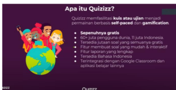
Gambar 1. Video Conference Penyampaian Materi Pelatihan

Tim pengmas berdiskusi dengan mitra terkait dengan materi kegiatan. Materi workshop yang disajikan adalah cara membuat Quizizz Account, penyusunan jenis soal yang ditentukan, men- share link soal kepada seluruh siswa, dan cara siswa untuk bisa bergabung mengerjakan soal Quizizz.