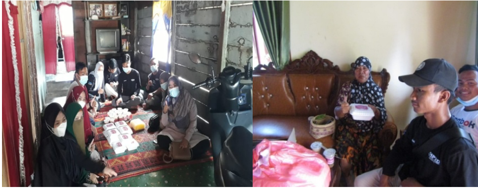
Gambar 8. Order Kuliner