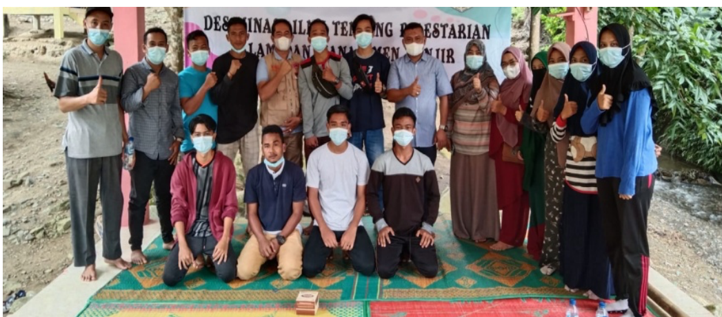
Gambar 4. Desiminasi Ilmu

Desiminasi ilmu ini bekerjasama dengan Dinas Pertanian dan Badan Penanggulangan Bencana Daerah Aceh Tenggara untuk berperan sebagai narasumber desiminasi ilmu tentang pelestarian alam dan manajemen bencana banjir. Kegiatan Desiminasi ilmu ini bertujuan memberikan gambaran pemeliharaan lingkungan wisata air terjun yang bersih dan asri serta memiliki kesiapan penanggulangan bencana banjir oleh kelompok pemuda pelestari alam.