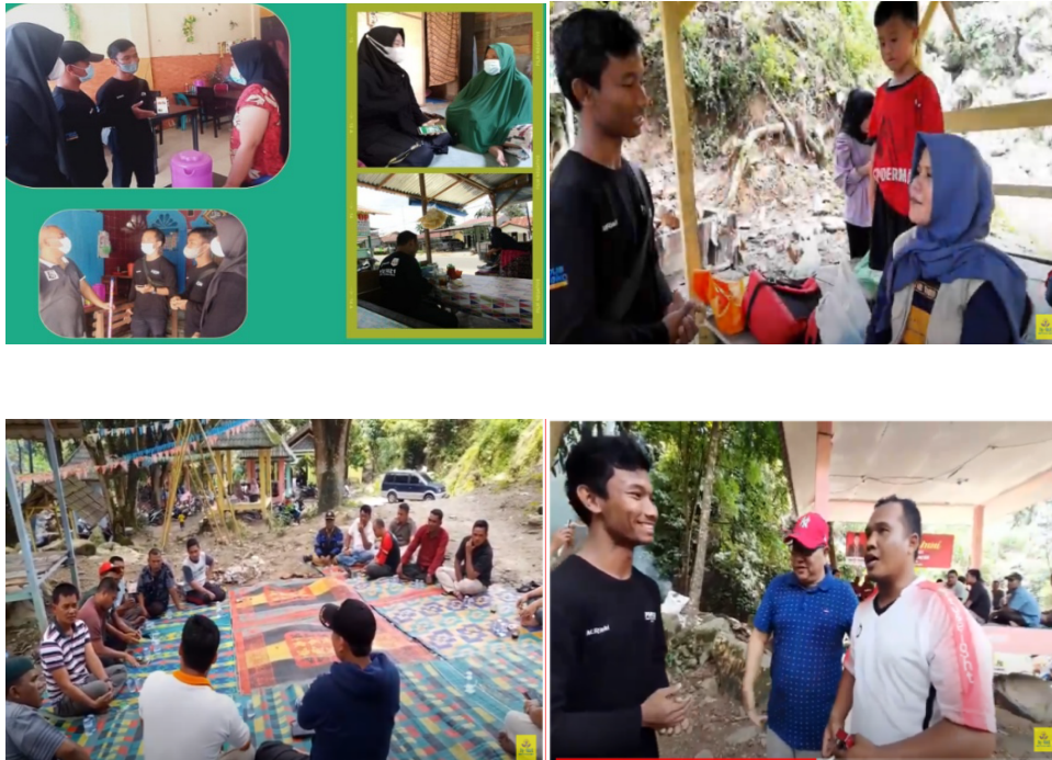
Gambar 7. Promosi platform Hy-FooT

Adapun pencapaian dalam kegiatan pengabdian kepada masyarakat “Pengembangan Potensi Wisata Air Terjun Modern dan Kuliner Lokal Melalui Traveling and Food ” mengacu pada beberapa indikator keberhasilan, antara lain: