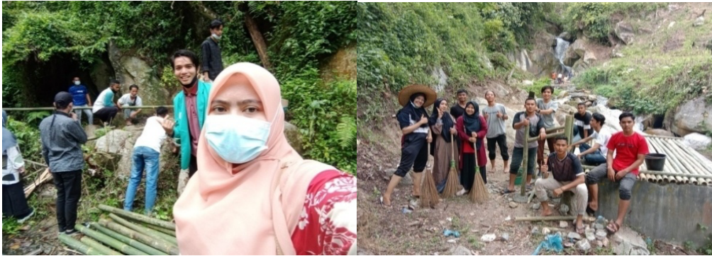
Gambar 5. Modifikasi wisata air terjun

Membuat dan mewarnai beberapa spot-spot foto, membuat gapura dan ucapan selamat datang di bagian depan dari lokasi wisata air terjun lawe dua serta melakukan launching wisata Air Terjun Lawe Dua.