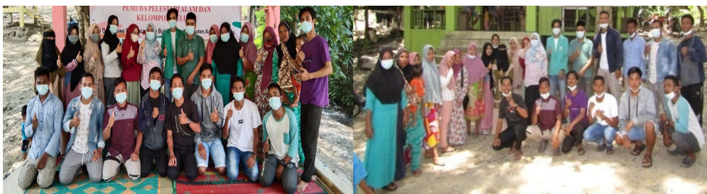
Gambar 2. Pembentukan dan Pembinaan Kelompok

Sedangkan pembinaan kedua kelompok tersebut, dimana kelompok Kuliner diberikan pemahaman tentang pengolahan dan pengemasan produk kuliner serta oleh-oleh yang kekinian. Pembinaan kelompok pemuda pelestari alam terkait tentang desain wisata air terjun dan pemeliharaan lingkungan wisata serta melatih pembuatan video atau cara mempublikasikan ke youtube. Studi Setianingsih, Amdani, & Utrisno (2018), pendampingan dan pembinaan kelompok masyarakat mendukung partisipasi masyarakat untuk memenuhi kebutuhan wisatawan yang berimplikasi terhadap peningkatan ekonomi dan kesejahteraan masyarakat.