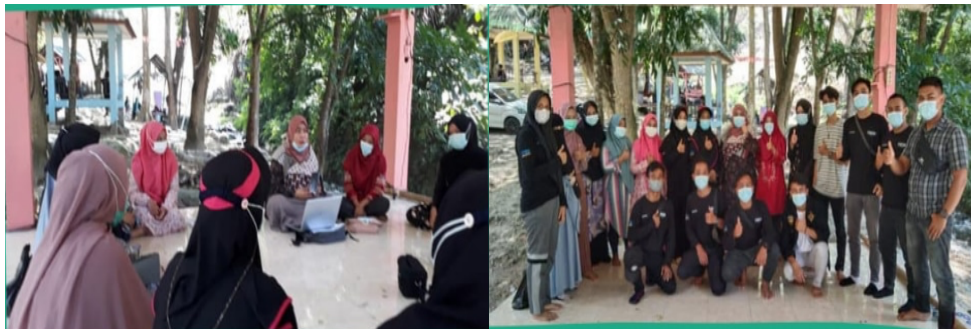
Gambar 6. Simulasi platform Hy-FooT

Simulasi platform Hy-FooT diberikan kepada kelompok pemuda pelestari alam dan kelompok kuliner di lokasi wisata air terjun lawe dua. Pada kegiatan simulasi mendeskripsikan terkait cara mengakses platform Hy-FooT “ www.hy-foot.com ” melalui laptop dan handphone dapat cara pemesanan kuliner, dan mengkonfirmasi pemesanan melalui whatsapp serta pembatalan pemesanan.