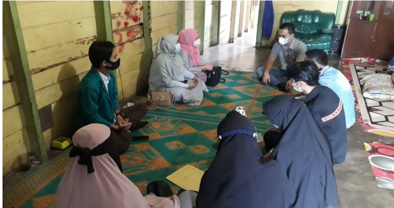
Gambar 1. Sosialisasi Kegiatan

Sosialisasi program pengabdian kepada masyarakat dilakukan kepada Penghulu dan Aparatur Desa Lawe Dua terkait gambaran kegiatan yang dilakukan bersama masyarakat dalam Pengembangan Potensi Wisata Air Terjun Modern dan Kuliner Lokal Melalui Traveling and Food . Penghulu dan Aparatur Desa Lawe Dua berpartisipasi mendukung keterlibatan masyarakat dalam program ini.