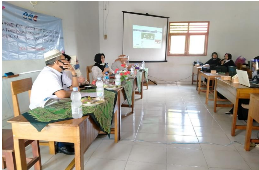
Gambar 3. Peserta Pelatihan Sedang Mendengarkan Penyampaian Materi