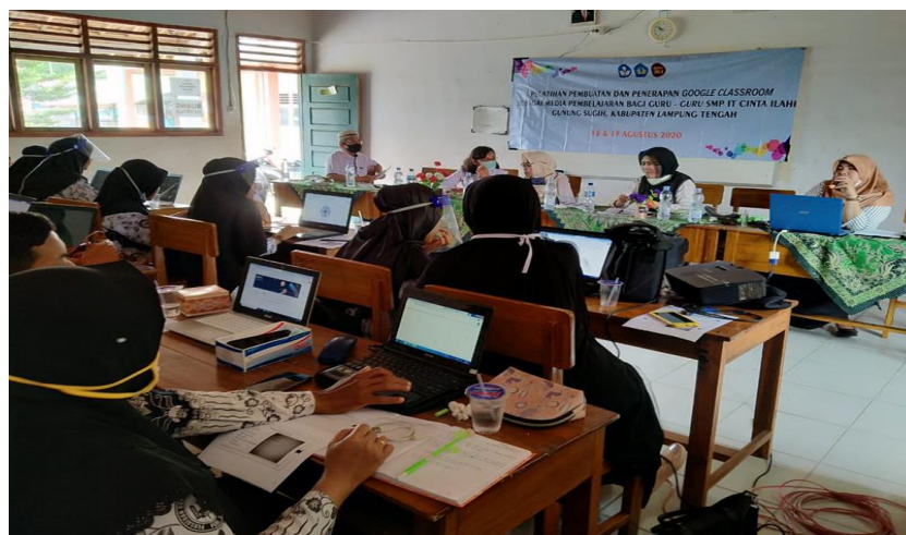
Gambar 1. Acara Pembukaan Kegiatan Pelatihan

Adapun rangkaian kegiatan dapat dilihat pada dokumentasi gambar berikut: