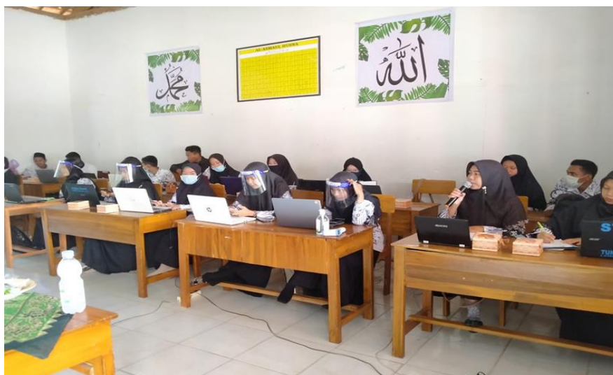
Gambar 4. Session Tanya jawab