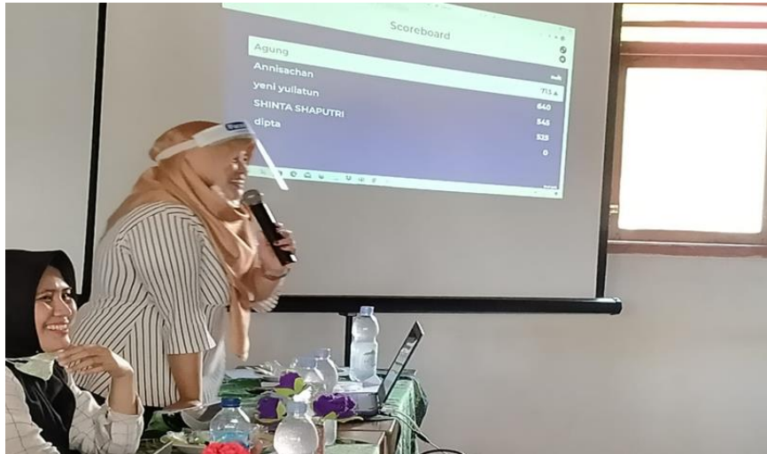
Gambar 2. Penyampaian Materi Kepada Peserta pelatihan