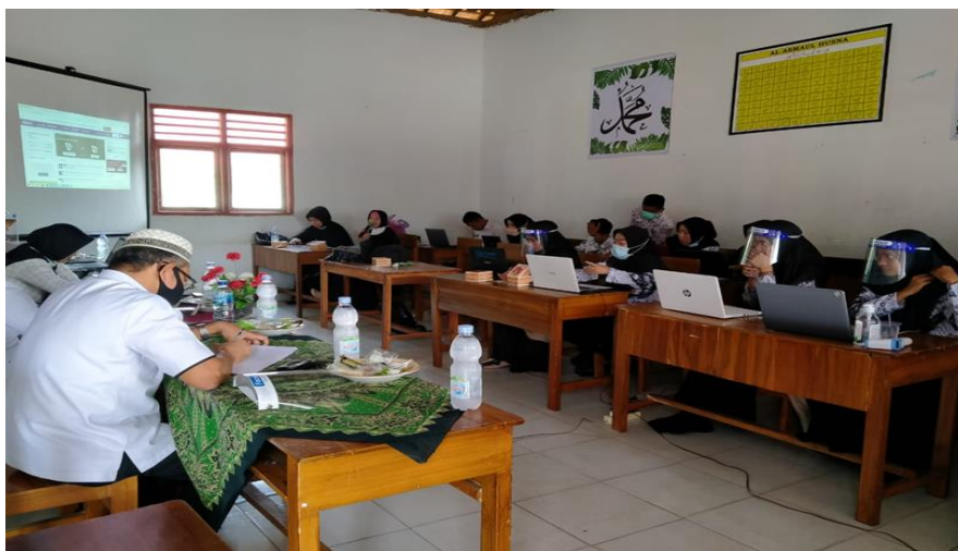
Gambar 5. Suasana Praktik

Secara keseluruhan Pelaksanaan pengabdian masyarakat selama dua hari yakni berjalan dengan lancar dan sesuai dengan yang diharapkan. Hal demikian dapat terjadi karena peserta pengabdian masyarakat begitu antusias dan tertarik mengikuti pengabdian masyarakat ini sehingga pelaksanaan pengabdian berjalan dengan lancar. Selain itu guru-guru SMP IT Cinta Ilahi Gunung Sugih Kabupaten Lampung Tengah juga memiliki keinginan yang sangat tinggi untuk terus aktif dan berkarya demi memajukan pendidikan dan demi tidak tertinggalnya dari kemajuan zaman dengan cara aktif pada proses pembelajaran terutama pada masa pandemi ini yang memerlukan suatu media pembelajaran berbasis digital/ theknologi sehingga memudahkan siswa dalam mempelajari materi yang diberikan guru dari manapun dan kapanpun.