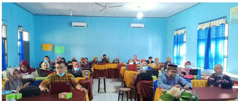
Gambar 2 penyajian materi

Kegiatan terkait literasi secara umum telah berjalan efektif dan tanpa insiden. Dibuktikan dengan keinginan mereka untuk bertanya lebih jauh tentang topik-topik spesifik yang dicakup oleh para narasumber, para peserta dengan jelas memahami konsep-konsep yang disajikan dan diimplementasikan oleh para ahli ini. Menanggapi kekhawatiran yang disuarakan oleh nara sumber, para peserta ditanyai tentang praktik literasi yang sering mereka lakukan. Pengukuran efikasi kegiatan ini dapat dilakukan melalui sesi tanya jawab. Pengukuran ini bertujuan untuk mengetahui apakah informasi yang diperoleh individu dari mengikuti kegiatan literasi benar-benar berkontribusi terhadap pengembangan kemampuan membaca dan pembudayaan membaca bagi generasi penerus bangsa. Program membaca dan menulis dievaluasi untuk menentukan apakah tujuan mereka telah tercapai. Berbagi informasi dengan peserta tentang berbagai strategi yang dapat diterapkan untuk meningkatkan kemampuan membaca menjadi tujuan dari kegiatan literasi ini. Oleh karena itu, setelah mengikuti kegiatan, peserta diharapkan dapat menerapkan membaca ekstensif baik di kelas maupun di rumah bersama anak atau muridnya sendiri.