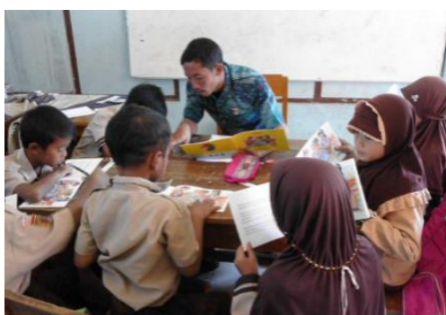
Gambar 3 reading activities

Mengingat betapa diterimanya kegiatan literasi ini, kegiatan literasi ini dapat dengan mudah menjadi bagian rutin dari kehidupan kelas dengan memanfaatkan perpustakaan sekolah. Dengan tujuan untuk menumbuhkan kecintaan membaca seumur hidup pada anak-anak dan memastikan bahwa mereka mempertahankan kemajuan mereka di bidang literasi. Untuk mencapai tujuan tersebut, kami akan menyerahkan laporan kegiatan ini kepada LPPM UNUSA dan mempublikasikannya dalam seminar dan jurnal. Kendala yang sering dialami sebagai kendala adalah kelangkaan bahan referensi yang sesuai dengan kebutuhan siswa.