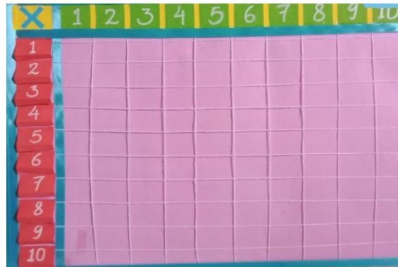
Gambar 3. Penggunaan Alat Peraga Matematika Tabel Perkalian

mungkin. Karena masih banyak siswa yang kurang memiliki kemampuan dalam mengerjakan tugas-tugas matematika dasar di tempat kerja. Hal ini disebabkan ketidakmampuan siswa yang terus menerus untuk menghafalkan fakta perkalian sederhana. Menanggapi masalah ini, siswa KKN menerapkan penggunaan alat peraga tabel perkalian dalam upaya untuk membantu rekan-rekan mereka memahami gagasan operasi aritmatika dan membuat matematika lebih menarik.