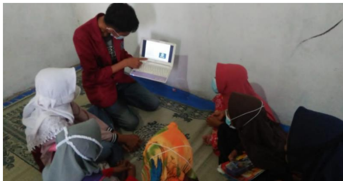
Gambar 2. Pendampingan Belajar Siswa

Awalnya Outcome bimbingan yang dilakukan di rumah warga Kecamatan Tiris terhadap siswanya. Dalam upaya mempraktekkan tri dharma perguruan tinggi, mahasiswa KKN mengikuti prakarsa pendampingan ini sebagai salah satu proyek pengabdian mereka kepada masyarakat. Bimbingan ini berlangsung setiap Rabu, empat kali sebulan, dalam pertemuan kecil yang mematuhi peraturan kesehatan. Kami berharap dapat membantu empat siswa di SD Negeri Ranuagung II dengan beberapa pelajaran tambahan.