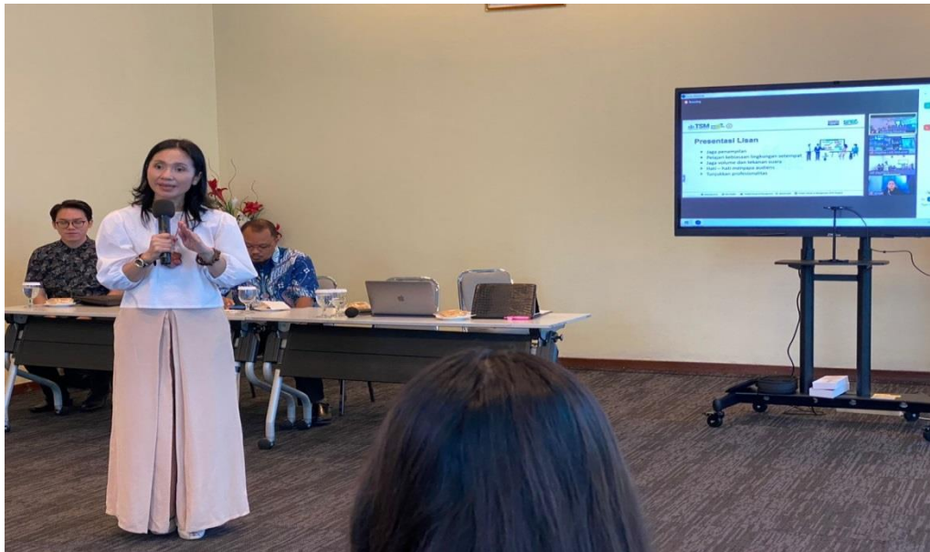
Gambar 2. Sesi Pelatihan, 2022