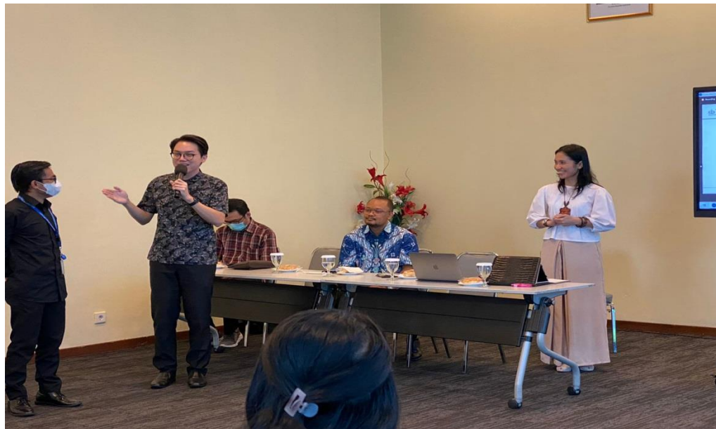
Gambar 3. Sesi Pelatihan, 2022