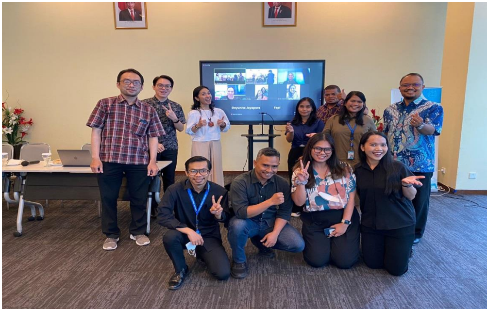
Gambar 4. Sesi Pelatihan, 2022

Para karyawan Lembaga Alkitab Indonesia (LAI) memiliki suatu kebiasaan yang sulit untuk diubah dalam hal berkomunikasi dan cara berpakaian (Suryawan et al., 2022, 1017), maka pada tahap awal perubahan ( unfreezing ), mereka dipacu untuk mau merubah kebiasaan lama dengan gaya berbicara yang baik dan menjaga penampilan demi image profesionalnya. Setelah perubahan ( unfreezing ) dilakukan, maka tahap berikutnya adalah pelaksanaan proses transisi ( movement ) menuju penyelesaian dan masuk pada tahap keberlanjutan ( refreezing ), untuk terbiasa melakukan komunikasi yang baik serta menjaga penampilan diri.