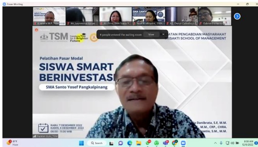
Gambar 3. Suasana Pelatihan, 2022

Dari seluruh peserta memberikan jawaban yang menarik dan juga menantang edukasi tentang investasi di pasar modal. Jawaban mereka antara lain: