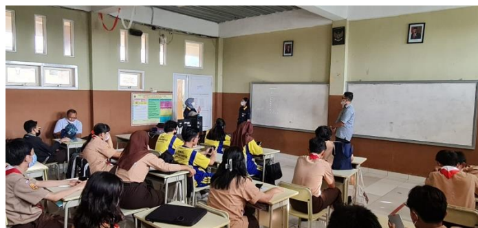
Gambar 2. Suasana Pelatihan, 2022

Materi edukasi disajikan dalam dua tahapan utama: yaitu Tahap Pertama ceramah, tanya-jawab dan diskusi tentang INVESTASI, mencakup : pengertian investasi, alasan berinvestasi, perencanaan keuangan, pemahaman tentang risiko, inflasi, jenis-jenis investasi, pasar modal, produk investasi di pasar modal, cara membuka akun dan memilih instrument investasi. Tahap kedua : Stock-Lab, yang merupakan latihan secara real-time melakukan transaksi di Bursa Efek Indonesia dengan menggunakan aplikasi (yang sudah didownload sebelumnya di masing-masing peserta), dan dilakukan pada sesi perdagangan saham di bursa efek. P3M TSM menugaskan dua kelompok tim yang memberikan literasi pasar modal ini, yaitu Dr. Aulia Danibrata, Yupiter Gulo, Emir Kharisma, dan Tim Stock-Lab oleh Arthon dan mahasiswa TSM.