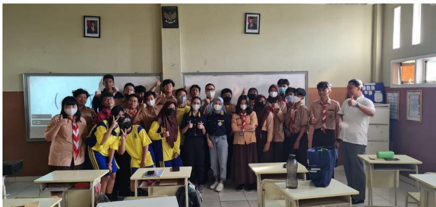
Gambar 5. Suasana Pelatihan, 2022

Pertanyaan-pertanyaan diatas menjadi indikasi sangat baik bahwa proses literasi pasar modal, investasi di saham maupun instrument lainnya menjadi penting dan mendesak dilaksanakan di lingkungan generasi milenial dan generasi Z. Program edukasi pasar modal ini akan efektif ketika yang meminta dan merencanakan dari pihak sekolah itu sendiri, dan didampingi secara konsisten oleh para guru-guru pengasuh yang menunjukkan minat serius terhadap investasi di pasar modal ini.