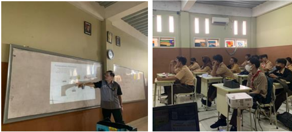
Gambar 1. Suasana Pelatihan, 2022

(2) SMA Katolik Santo Josef, Pangkal Pinang, pada tanggal 7 dan 8 Desember 2022, dan diikuti oleh siswa-siswa kelas 10, 11 dan 12 dengan total peserta 200 orang, termasuk sejumlah guru yang sangat berminat mengetahui cara berinvestasi di Bursa Efek Indonesia.