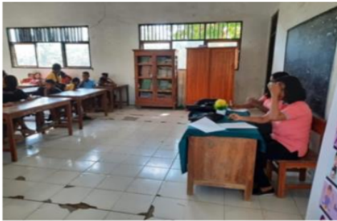
Gambar 1. Persiapan pre test

Kegiatan PKM ini dilaksanakan dalam tiga tahapan yaitu tahapan persiapan, pelaksanaan dan evaluasi di akhir