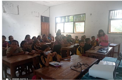
Gambar 2. Kegiatan penyuluhan

Sebelum kegiatan penyuluhan dilakukan siswa terlebih dahulu mengisi lembar kuesioner yang telah disediakan oleh tim. Tujuannya dilakukannya pre-test adalah untuk mengukur sejauh mana pengetahuan dan pemahaman siswa mengenai gizi seimbang.