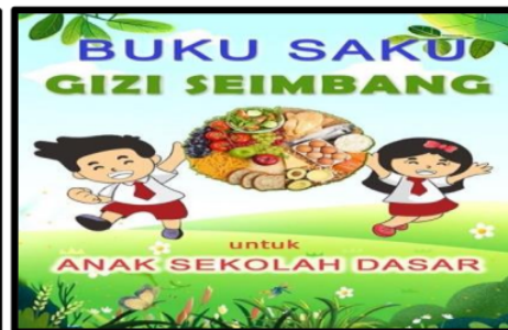
Gambar 4. Buku saku gizi seimbang

Kegiatan pengabdian pada masyarakat ini dilaksanakan dengan metode ceramah dan pemutaran video animasi sesuai dengan topik kegiatan. Penggunaan video animasi dalam kegiatan ini menambah antusiasme para siswa untuk menyimak informasi yang disampaikan. Lebih lanjut tim juga membagikan buku saku gizi yang berisi informasi bergambar mengenai gizi seimbang, peran gizi dalam proses tumbuh kembang dan dampak kelebihan/kekurangan gizi. Penggunaan metode ini dianggap sebagai metode yang efektif untuk diterapkan pada anak usia sekolah.