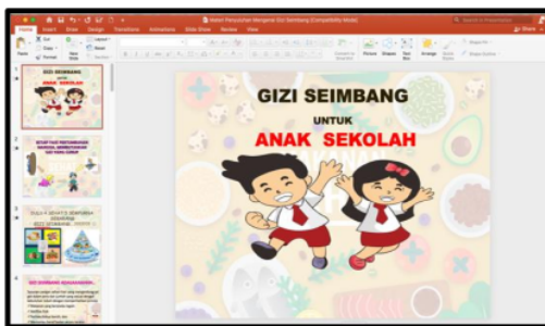
Gambar 3. Materi penyuluhan gizi seimbang

Sebelum kegiatan penyuluhan dilakukan siswa terlebih dahulu mengisi lembar kuesioner yang telah disediakan oleh tim. Tujuannya dilakukannya pre-test adalah untuk mengukur sejauh mana pengetahuan dan pemahaman siswa mengenai gizi seimbang.