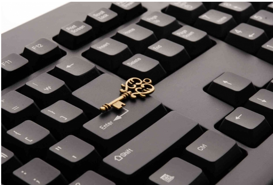
Kunci Kesuksesan Usaha