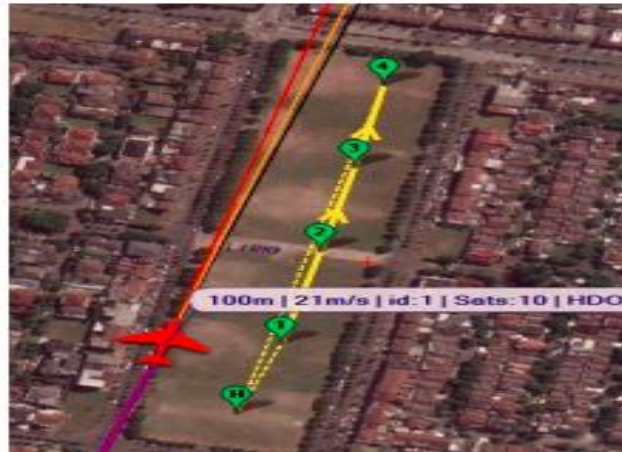
Gambar 2. Metode Waypoint Fly by

Sistem navigasi autonomous pada pesawat tanpa awak yang paling banyak digunakan saat ini adalah sistem navigasi berbasis waypoint. Sistem navigasi waypoint ini adalah sekumpulan data berupa titik koordinat untuk menyatakan suatu titik pada peta. Dalam satu waypoint terdapat posisi longitude, latitude dan juga altitude dari titik tersebut. Metode waypoint ini dibagi menjadi dua jenis, yaitu metode waypoint fly by dan metode waypoint fly over. Berikut adalah implementasi dari metode waypoint fly by pada Gambar 2.