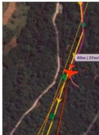
Gambar 3. Metode fly over

Metode waypoint fly by yaitu ketika pesawat tanpa awak terbang tidak melewati lokasi di atas waypoint namun tetap menuju ke arah yang dituju. Selain metode waypoint flyby ada pula metode fly over dapat ditunjukkan pada Gambar 3.