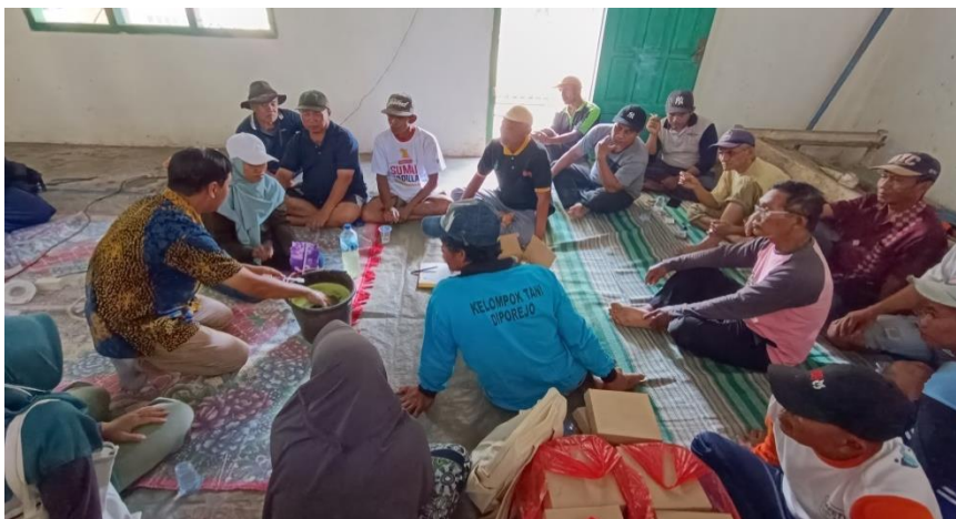
Gambar 3. Demonstrasi pembuatan pestisida daun pepaya

Pada kegiatan pengabdian ini kami juga memaparkan hasil Penelitian dari para peneliti terkait uji kinerja pestisida berbahan daun pepaya, yang telah dianalisa dengan melihat pengaruh waktu perendaman, konsentrasi bahan baku dan modifikasi bahan baku terhadap waktu kematian hama. Efek racun dianalisa menggunakan uji sisa residu pada daun dan efek kontak. Hasil yang diperoleh menunjukkan bahwa pestisida daun pepaya sangat efektif digunakan untuk untuk membunuh jenis hama rayap dengan waktu kematian tercepat diperoleh 10 menit pada pestisida termodifikasi deterjen:minyak tanah:pestisida = 1:5:1, waktu perendaman 18 jam. Uji efek racun menunjukkan pestisida termodifikasi mampu menghilangkan hama rayap mencapai 100%, ulat dan kutu daun 80% sedangkan tanpa modifikasi hanya 40% untuk ketiga jenis hama (Hasfita dkk, 2013). Hal ini menunjukkan bahwa pestisida nabati daun pepaya sangat efektif untuk diaplikasikan.