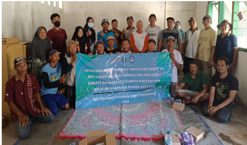
Gambar 4. Foto bersama mitra pengabdian pestisida nabati