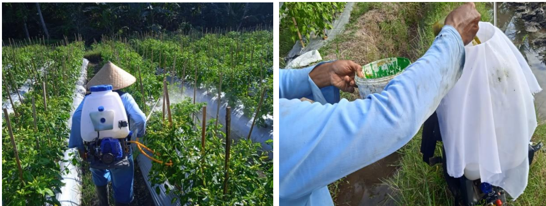
Gambar 5. Aplikasi pestisida nabati daun pepaya pada lahan budidaya cabai

Daun pepaya yang banyak mengandung zat aktif seperti enzim papain, alkaloid, dan glikosid dirasa sangat efektif untuk mengendalikan hama ulat, hama penghisap, aphid, rayap, hama kecil, dan ulat bulu. Cara pengaplikasian pestisida nabati daun pepaya adalah dengan mengencerkan atau melarutkan larutan pestisida nabati sebanyak 2 gelas air mineral ukuran 220 mL dengan 10 Liter air untuk satu tangki sprayer . Penyemprotan ini dilakukan pada pagi ataupun sore hari dengan frekuensi penyemprotan 3x dalam seminggu. Frekuensi penggunaan pestisida nabati secara permanen tidak menimbulkan kerusakan apapun, seperti halnya dalam penggunaan pestisida kimiawi/sintetis (Jujuaningsih dkk, 2021). Kegiatan aplikasi pestisida nabati daun pepaya terdapat pada gambar 5. Pada kegiatan Pengabdian ini kami menghibahkan knapsack power sprayer yang telah kami modifikasi. Modifikasi yang kami berikan adalah penambahan corong pada bagian ujung sprayer agar pestisida daun pepaya ketika diaplikasikan fokus dan tepat sasaran, dapat tersebar merata ke seluruh bagian tanaman.