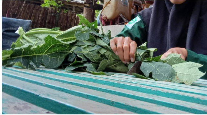
Proses pemotongan daun pepaya