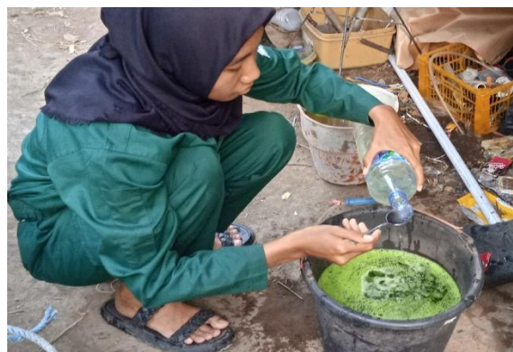
Pencampuran larutan pestisida daun pepaya