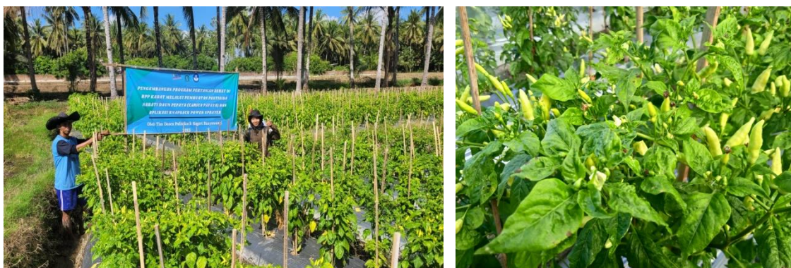
Gambar 6. Kegiatan Monitoring pada lahan kelompok tani

Kegiatan monitoring dilakukan setiap 2 minggu sekali dengan melakukan kunjungan lapang pada lahan budidaya milik petani. Kegiatan monitoring ini dilakukan untuk memantau perkembangan kelompok tani dalam memproduksi pestisida hingga aplikasi pestisida nabati pada lahan pertanian. Kegiatan monitoring ini juga berfungsi untuk mengumpulkan informasi dan permasalahan ataupun kendala yang dihadapi oleh para petani. Kegiatan monitoring terdapat pada gambar 6. Hasil kegiatan monitoring menunjukkan bahwa kelompok tani aktif dalam memproduksi pestisida nabati daun pepaya, pengaplikasian dilakukan dalam 1 minggu sebanyak 3 kali, penyemprotan dilakukan pada pagi dan sore hari. Tanaman cabai yang dibudidayakan terpantau dalam kondisi sehat dan belum ada tanda-tanda munculnya serangan OPT pada lahan petani.