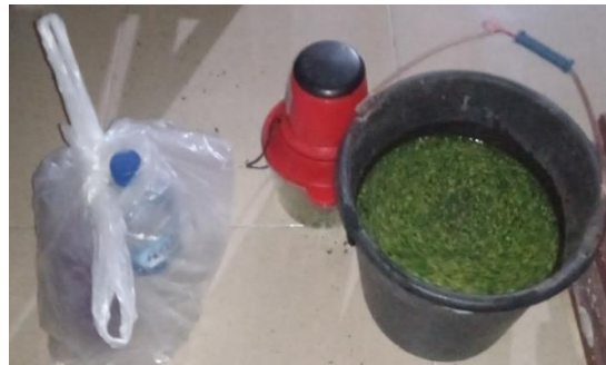
Persiapan bahan tambahan (minyak tanah dan detergen)