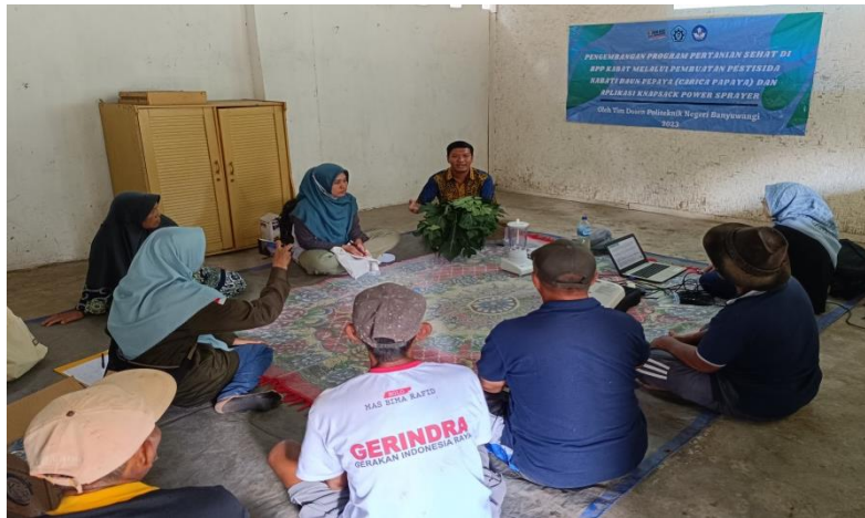
Gambar 2. Sosialisasi Pestisida Nabati Daun Pepaya bersama Mitra

Zat dan senyawa bioaktif yang terdapat dalam pestisida nabati bila kita aplikasikan ke tanaman yang terinfeksi Organisme Penggangu Tanaman (OPT), tidak mempengaruhi proses fotosintesis, pertumbuhan tanaman ataupun aspek fisiologis tanaman, tetapi memiliki pengaruh terhadap reproduksi, sistem saraf otot, keseimbangan hormon, perilaku berupa anti makan, penarik, serta sistem pernafasan hama. Pestisida daun pepaya diyakini memiliki efektifitas yang tinggi dan dampak spesifik terhadap OPT tanaman. Bahan aktif daun pepaya juga tidak berbahaya bagi hewan dan manusia (Setiawati dkk, 2008). Setelah dilakukan sosialisasi, maka kegiatan berikutnya yang dilakukan adalah demonstrasi kepada mitra terkait bagaimana proses dan prosedur yang aman dalam membuat pestisida nabati (gambar 3). Kegiatan sosialisasi diakhiri dengan melakukan foto bersama (gambar 4).