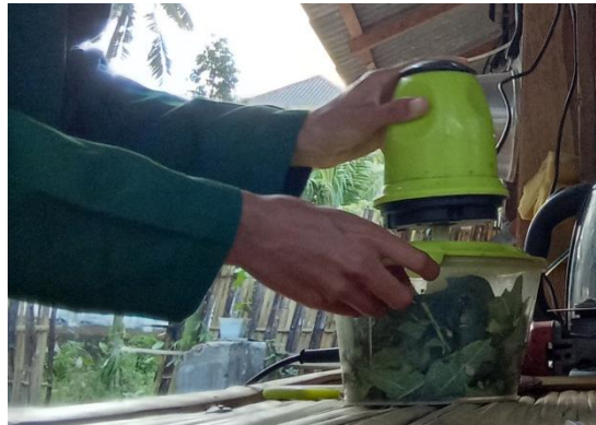
Pembuatan larutan daun pepaya dengan menggunakan blender