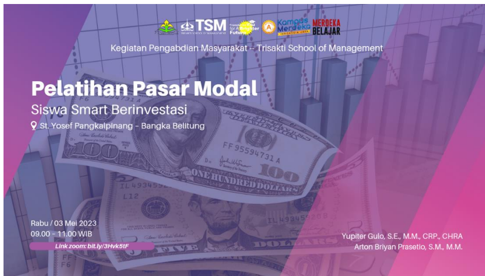
Gambar-1: Tema Utama Pelatihan Pasar Modal P3M TSM

Oleh karena itu, kegiatan literasi pasar modal ini dikerjakan dalam dua tahapan besar, yaitu mendiskusikan dasar-dasar pemahaman investasi, dan kedua berlatih secara realtime melakukan trading/transaksi jual – beli saham di Bursa Efek Indonesia. Dengan dua tahapan ini, maka pengalaman siswa menjadi lengkap, tidak hanya teori tetapi juga dengan praktek secara real-time.