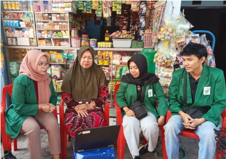
Gambar 2 Sosialisasi aplikasi MyKasir kepada Ketua RT 6 RW 6

Sosialisasi offline adalah salah satu metode yang penting untuk memperkenalkan dan mempromosikan fasilitas Aplikasi MyKasir kepada warga di RT 6 RW 6 Kelurahan Banyu Urip, Kota Surabaya. Sosialisasi offline menghadirkan kesempatan langsung untuk berinteraksi dengan warga, menjawab pertanyaan mereka, dan memberikan pemahaman yang lebih mendalam tentang aplikasi ini.