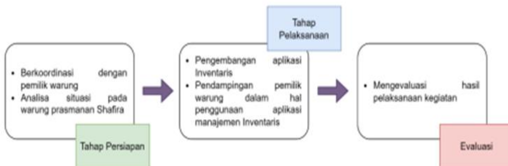
Gambar 3. Alur Metodologi dan Evaluasi Kegiatan

Serangkaian proses yang dilakukan meliputi 3 tahapan yaitu Tahap Persiapan, Pelaksanaan, dan Evaluasi. Untuk tahapan tersebut akan tersaji pada gambar 3.