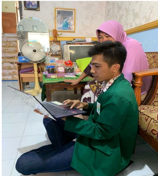
Gambar 4. Pendampingan Aplikasi Penjualan

fitur yang tersedia. Setelah dilakukan pendampingan saat ini pemilik sudah dapat mengoperasikannya secara mandiri. Dan aplikasi sudah dapat digunakan untuk membantu proses bisnis yang dilakukan di Toko Sembako Bu Riya.