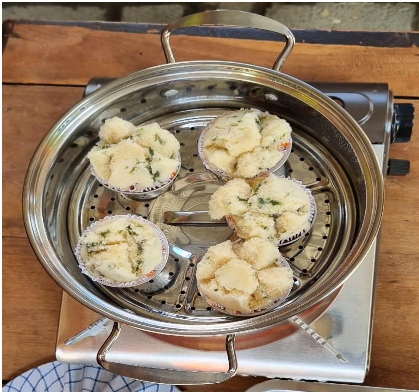
Gambar 2 (a) Hasil Praktik Pembuatan Bolu Kukus Bayam sebagai PMT

Berdasarkan hasil pelaksanaan kegiatan bahwa kegiatan pelatihan pada kader posyandu berhasil memberikan pengetahuan tentang membuat kudapan sehat bergizi sebagai Makanan Tambahan balita dengan menggunakan bahan tambahan berupa sayur. Keberhasilan kegiatan pengabdian dapat dilihat berdasarkan beberapa indikator berikut, yaitu: