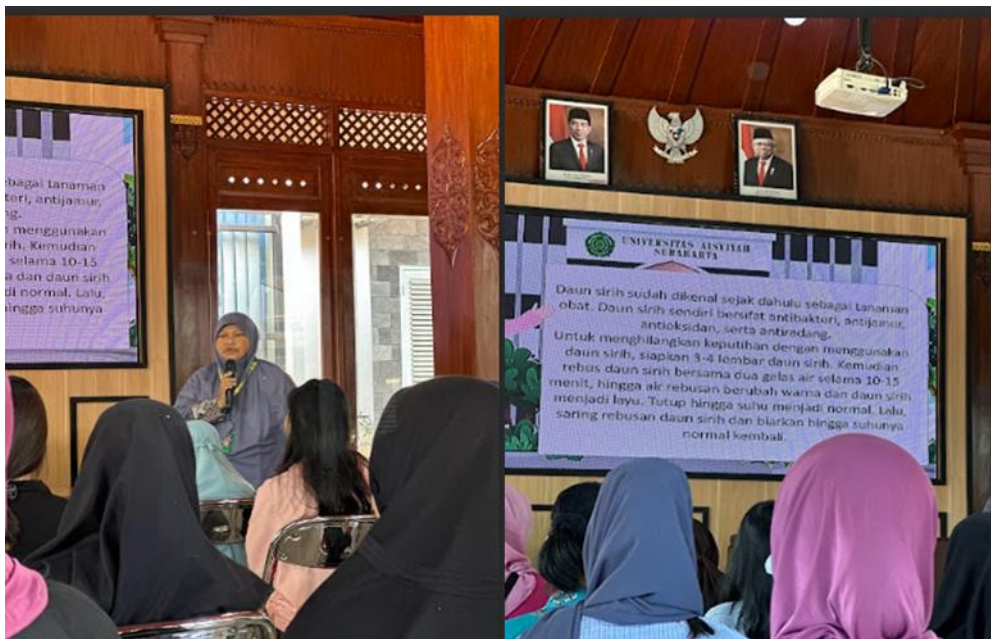
Gambar 2. Pemamaparan Materi Kesehatan Reproduksi Remaja