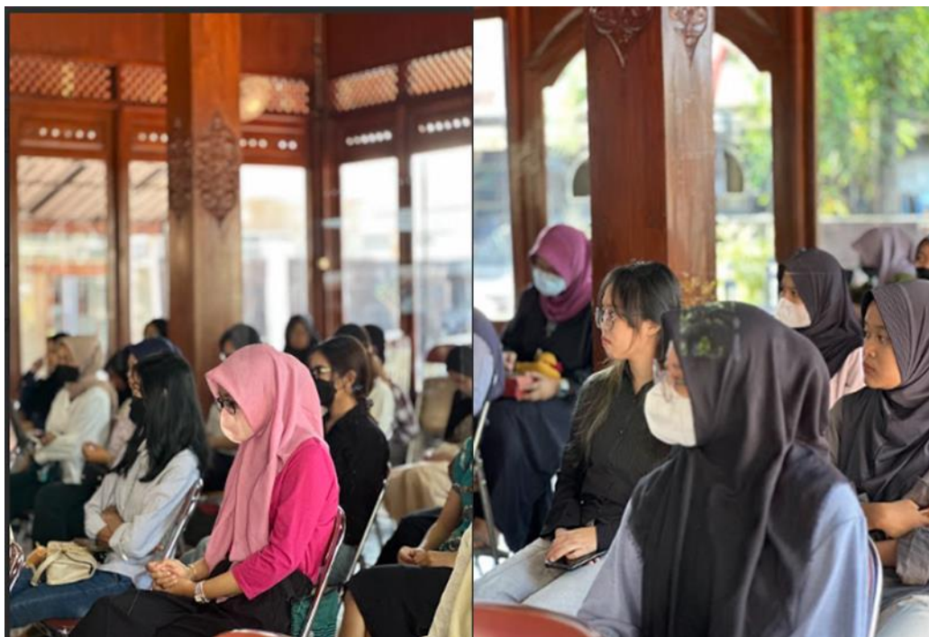
Gambar 3. Peserta Menyimak Pemaparan Materi Kesehatan Reproduksi Remaja

Diskusi dan tanya jawab sangat bermanfaat bagi semua peserta, karena dapat menambah pengetahuan yang dapat diterapkan dalam kehidupan sehari-hari. Misalnya dalam hal merawat kebersihan organ reproduksi wanita. Konsep perawatan genetalia eksterna pada hari biasa dan selama menstruasi adalah sebagai berikut: cuci tangan dengan sabun sebelum membersihkan organ seksual dan reproduksi, siapkan handuk/tisu untuk mengeringkan organ seksual dan reproduksi, setelah buang air, cuci tangan dengan sabun, setelah buang air besar (BAB) siramkan air dari arah depan (kemaluan) ke belakang anus, jangan sebaliknya, hindari penggunaan sabun/cairan kimia khusus pembersih vagina, ganti celana dalam minimal 2 kali sehari, celana dalam yang kotor atau celana dalam yang sudah dipakai hari sebelumnya dapat menyebabkan infeksi organ reproduksi jika dipakai terlalu lama, pilih celana dalam dari bahan katun yang mudah menyerap keringat, hindari