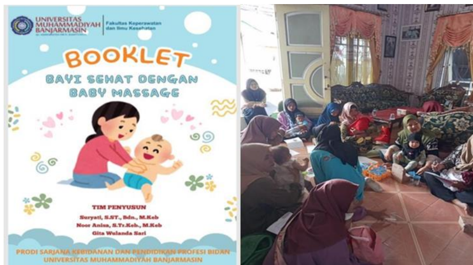
Gambar 2. Pembagian booklet untuk peserta

Setelah selesai mengisi pre test, para peserta mendapatkan booklet baby massage. Kemudian, peserta mendapatkan edukasi dari Tim. Selama kegiatan berlangsung terlihat peserta sangat antusias memperhatikan.