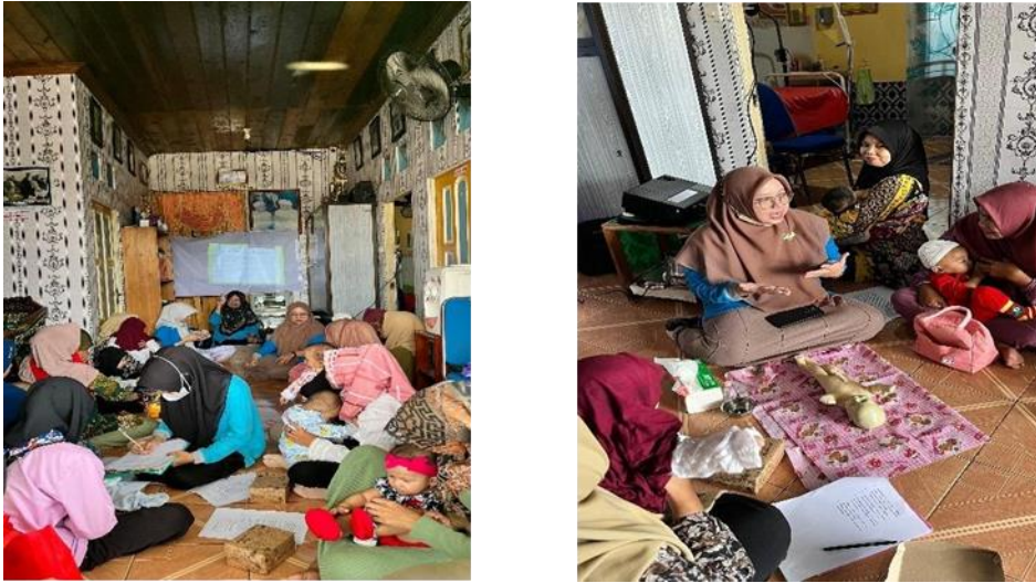
Gambar 3. Pemberian edukasi dan Demonstrasi Stimulasi tummbuh kembang anak dengan baby massage

Kemudian dilanjutkan dengan sesi tanya jawab mengenai hal-hal yang belum dipahami oleh peserta. Adapun beberapa pertanyaan yang diajukan adalah: