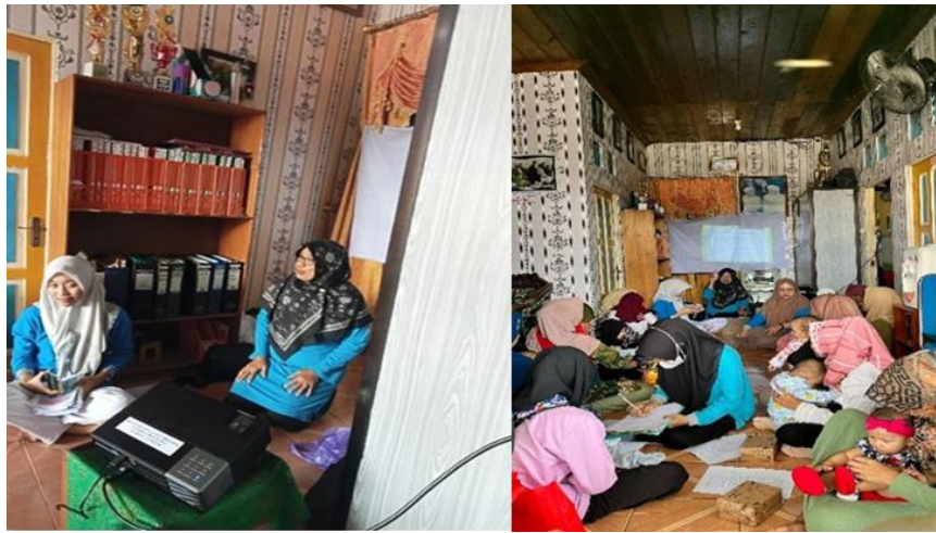
Gambar 1. Pengenalan anggota tim pengabdian masyarakat dan dilanjutkan dengan pembagian kuesioner pre test pada peserta

Setelah selesai mengisi pre test, para peserta mendapatkan booklet baby massage. Kemudian, peserta mendapatkan edukasi dari Tim. Selama kegiatan berlangsung terlihat peserta sangat antusias memperhatikan.