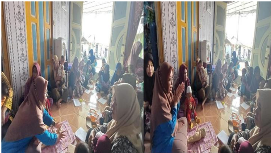
Gambar 4. Peserta bertanya terkait materi yang belum dipahami

Setelah kegiatan berakhir dilakukan evaluasi dengan memberikan post test kepada peserta yang berisi pertanyaan yang sama dengan pre test. Skor pre test yang sudah didapatkan kemudian dibandingkan dengan skor post test. Hal ini dilakukan untuk mengetahui ada dan tidaknya peningkatan pengetahuan peserta. Adapun beberapa hasil pelaksanaan yang didapatkan sebagai berikut: