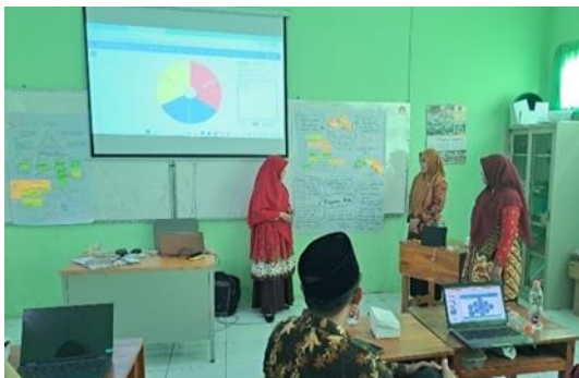
Gambar 3. Presentasi Hasil

Hasil pengabdian kepada masyarakat, nampak bahwa peserta antusias menyimak materi yang disampaikan, mengikuti rangkaian kegiatan sampai akhir. Peserta juga aktif selama diskusi dan tanya jawab. Peserta secara berkelompok membuat mind mapping dan unjuk kerja analisis kasus disiplin positif. Peserta dilatih untuk memahami langkah-langkah yang harus dilakukan apabila menemukan peserta didik yang melakukan tindakan disiplin. Solusi atau tindakan apa yang tepat untuk dilakukan.