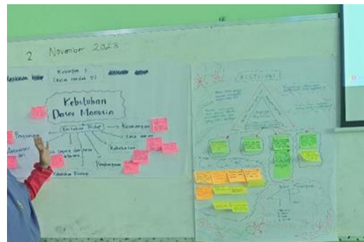
Gambar 4. Hasil mind mapping peserta