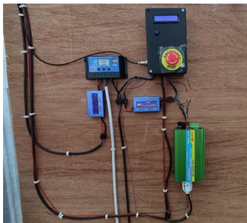
Gambar 3. Rangkaian system penyiraman otomatis

Peningkatan kebutuhan energi listrik oleh masyarakat tidak sebanding dengan keterbatasan ketersediaan sumber daya energi (Putri et al. 2024). Penerapan alat penyiraman otomatis berbasis Arduino panel surya di Desa Gekbrong telah berhasil memenuhi kebutuhan penyiraman tanaman hortikultura secara efisien. Sumber energi dari panel surya, alat ini mampu beroperasi secara mandiri tanpa bergantung pada listrik PLN, yang penting untuk wilayah yang mungkin mengalami keterbatasan pasokan listrik. Mengingat lokasi Indonesia di daerah tropis, di mana panas matahari tersedia sepanjang tahun, penggunaan energi surya sebagai alternatif untuk memenuhi kebutuhan listrik negara sangatlah tepat. Upaya meningkatkan penyerapan cahaya matahari, solar cell harus dipasang berhadapan dengan arah sinar matahari atau selalu mengikuti arah pergerakannya. Akibatnya, sistem pengawasan diperlukan untuk pemasangan solar cell (Chrisna 2020).