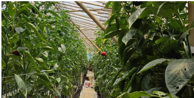
Gambar 1. Tanaman paprika di dalam green house Kelompok Tani Gede Harepan

Desa Gekbrong masuk kategori desa berkembang dengan tingkat perkembangan swakarya. Desa Gekbrong mempunyai letak geografis 6^{\circ}51'57'' Lintang Selatan dan 107^{\circ}1'49'' Bujur Timur dan sebagian posisi wilayahnya berupa lereng. Desa ini mempunyai empat dusun, 11 RW (rukun warga) dan 35 RT (rukun tetangga). Total jumlah penduduknya sebanyak 9.800 jiwa atau 2.940 KK, yang terdiri dari laki-laki (4.032 jiwa) dan perempuan (3.034 jiwa), dengan laju pertumbuhan penduduk dari tahun 2010 – 2020 sebesar 2,44% (Sumaryadi, 2019; BPS Kabupaten Cianjur 2021b). Mayoritas kelompok tani mempunyai pekerjaan sebagai petani dan buruh tani, dengan menanam berbagai jenis tanaman hortikultura seperti kubis, wortel, jagung, terong, cabai, tomat, jagung, kentang dan paprika (Dharma dan Roslaini, 2020). Tanaman hortikultura yang ditanam Kelompok Tani Gede Harepan berbeda-beda jenisnya, biasanya tergantung pada musim, kebutuhan pasar, dan dana yang tersedia. Tanaman hortikultura yang ditanam memiliki umur 3 – 4 bulan untuk siap panen dan dijual.