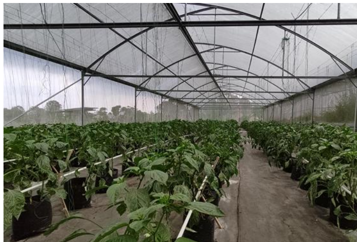
Gambar 4. Pralon dalam mengalirkan air ke polybag tanaman

Pada segi produktivitas, tanaman hortikultura yang menggunakan sistem penyiraman otomatis ini diharapkan dapat menambah pertumbuhan tanaman menjadi lebih baik dan hasil panen tanaman paprika bisa meningkat hingga 15-20% dibandingkan tanaman yang disiram secara manual. Hal ini disebabkan oleh penyiraman yang lebih merata dan sesuai kebutuhan, sehingga tanaman mendapatkan asupan air yang cukup pada setiap fase pertumbuhannya.